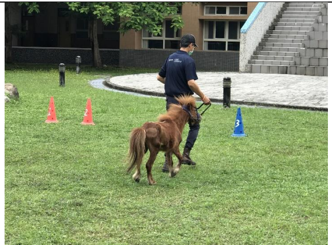
教練示範人領馬的操作