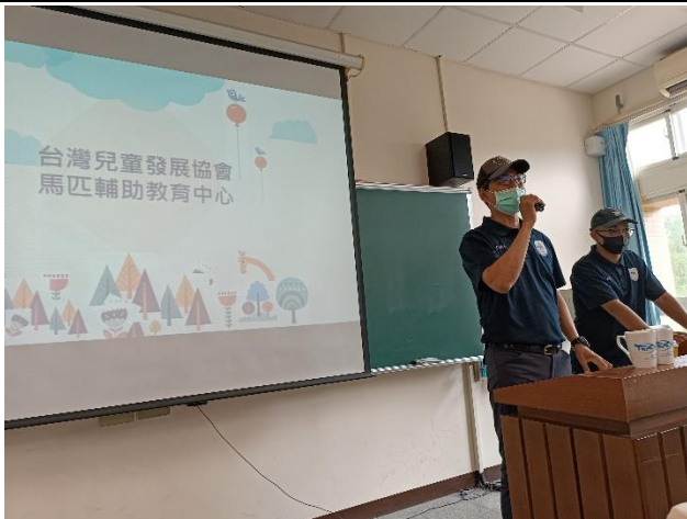
兩位教練先在課室分享中心相關業務與概念