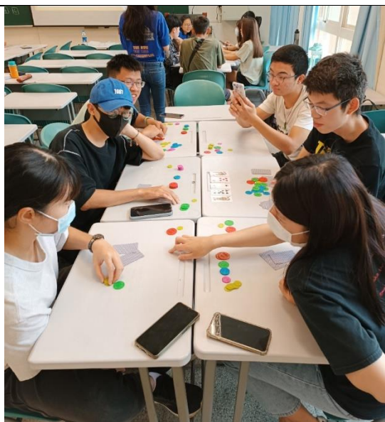
期末報告：德州撲克分組體驗 (分五組進行)