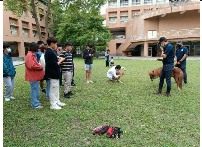
戶外進行馬匹體驗活動