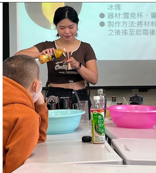
期末報告：調酒研究社：飲調分組體驗 (分兩組進行)