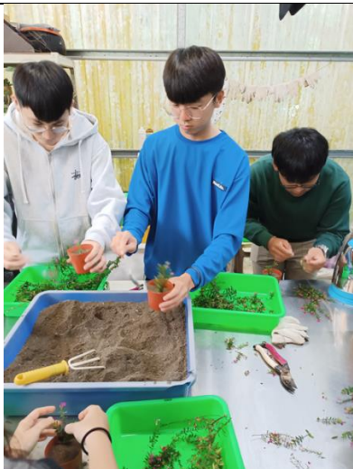
製作屬於自己的小盆栽