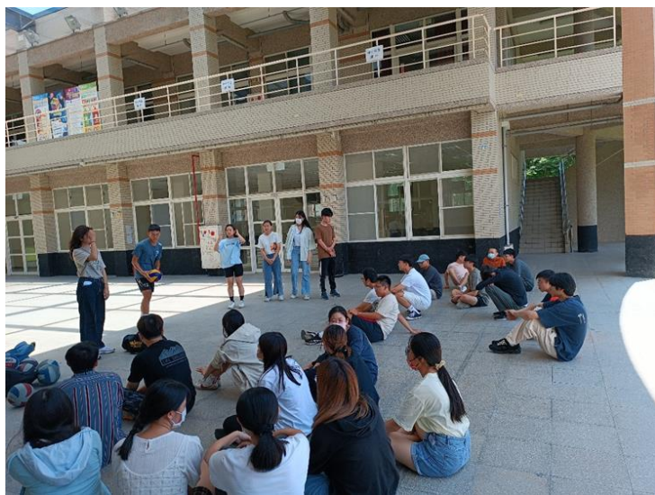
期末報告：排球社：教授兩種基本傳球(舉球與低手傳球)