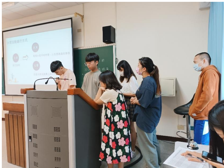
期末報告：熱舞社：教授 hiphop