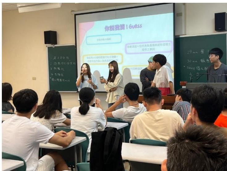
期末報告：英語文化社 分組兩組 QA 搶答