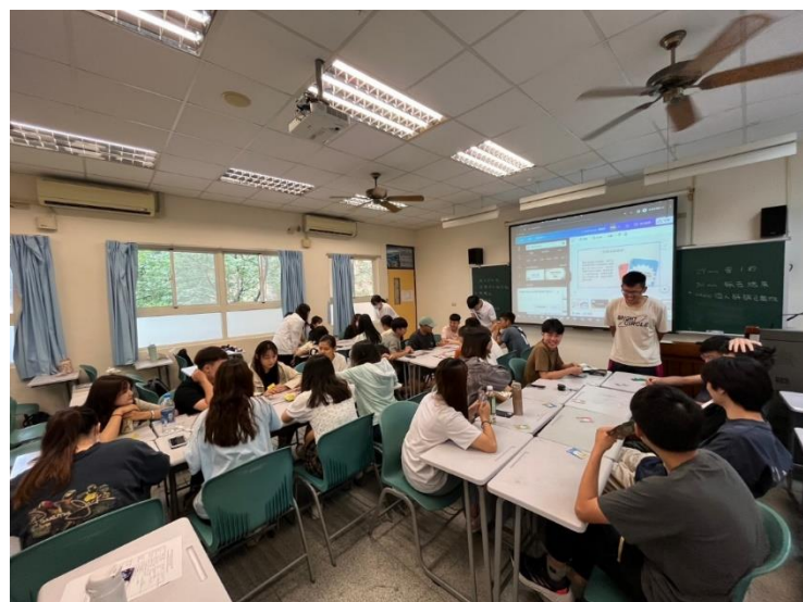
期末報告：遊戲文化研究社 分5組進行三種桌遊