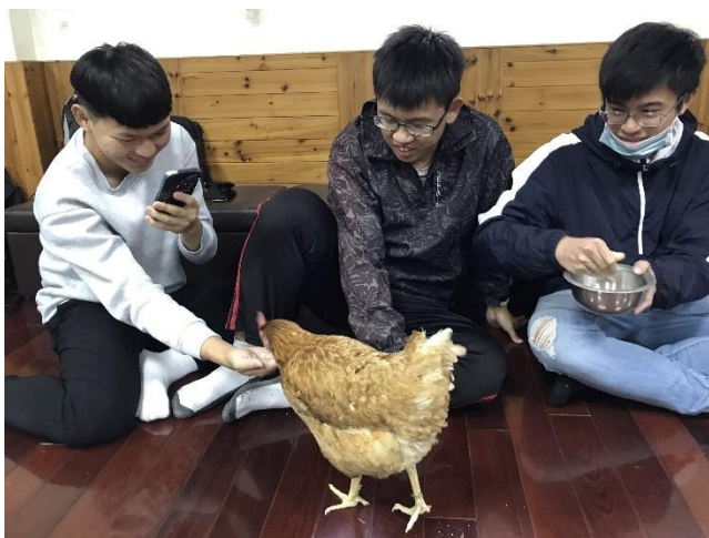
與療癒雞第一次親密接觸