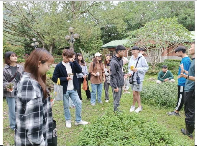
戶外採集適合的細葉雪茄花