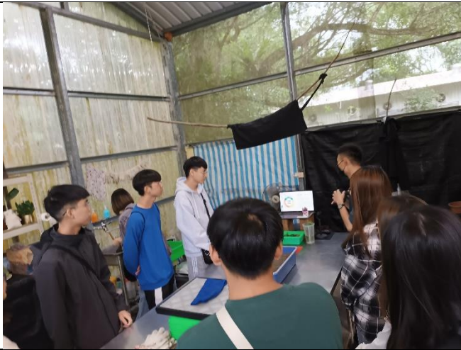
在溫室進行植物扦插概念講解