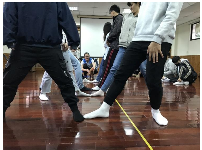
療癒雞與學生團體互動 1