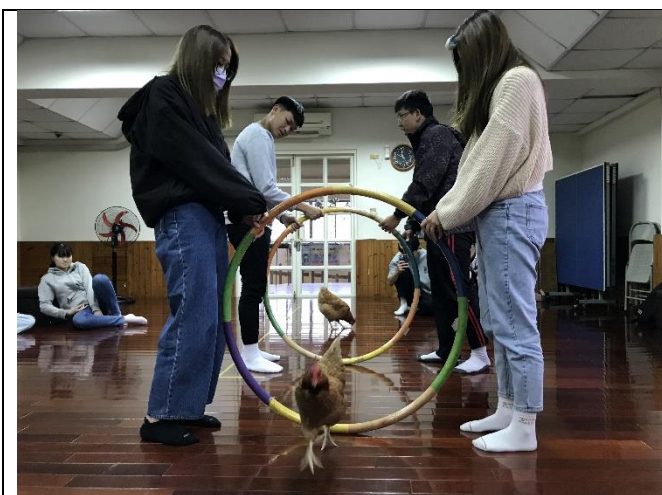
療癒雞與學生團體互動 2