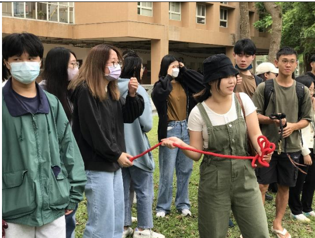
先進行人領人的操作