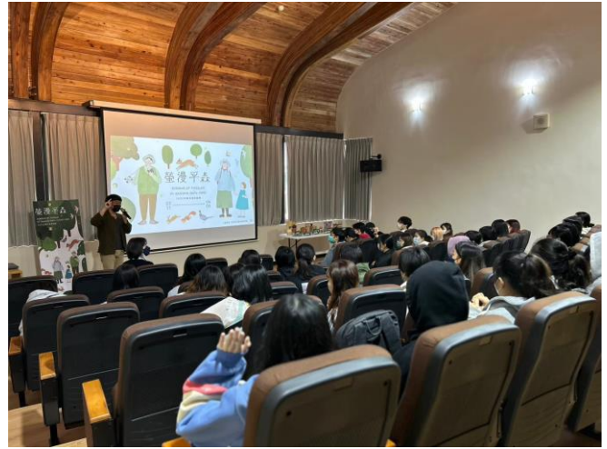
業師分享賞螢季活動策劃與執行