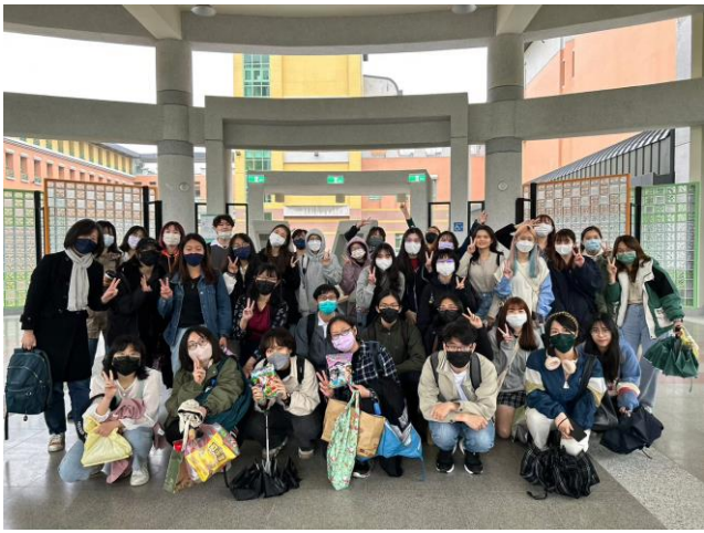
參訪大農大富合影