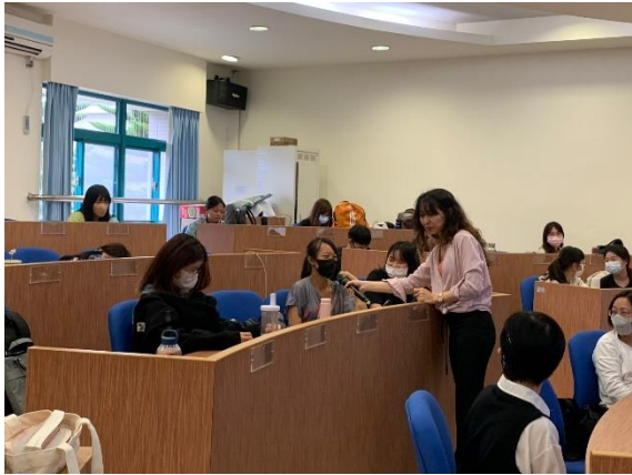
秋惠老師演講時下去與學生進行互動