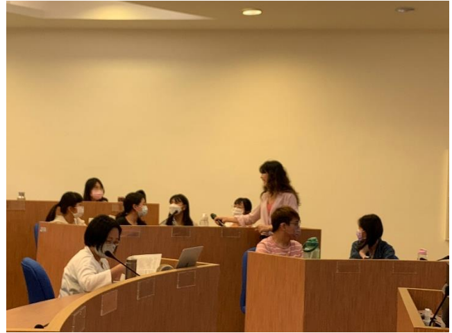
秋惠老師走到台下互動，傾聽同學的回覆