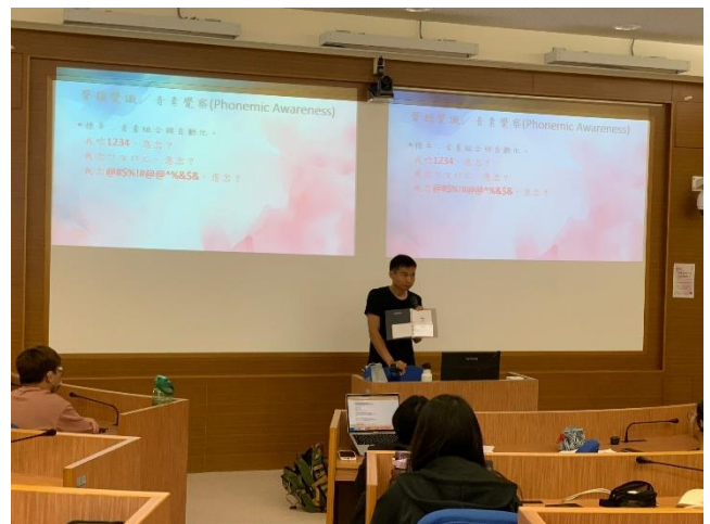
皓博老師向同學展示教具及介紹音韻覺識