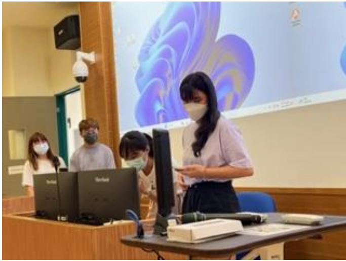
同學們教師訪談期末分享會