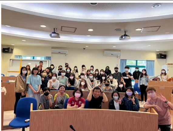
全體參與講座同學與皓博老師進行大合照