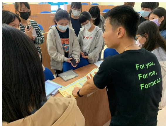
講座結束，同學仍對新興雙母語教學很有興趣