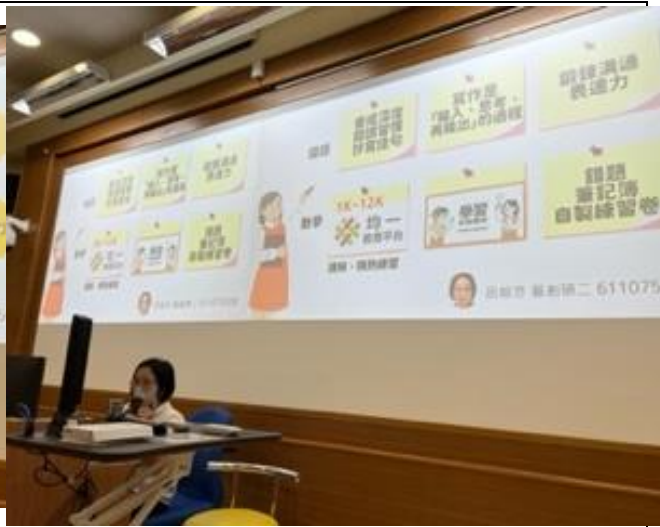
同學上台報告分享讀書策略