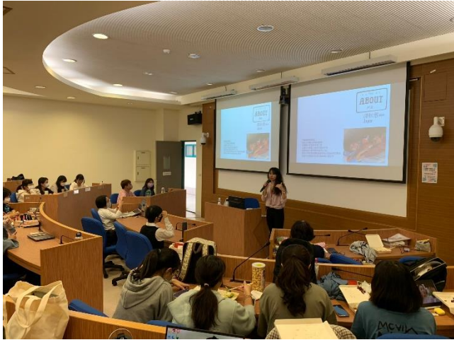
秋惠老師認真為同學演講