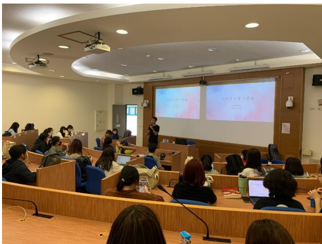
皓博老師自我介紹，為講座進行開場