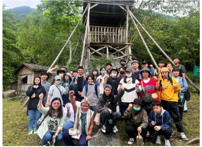
校外參訪，全體與守望台及獵人戴明流合影