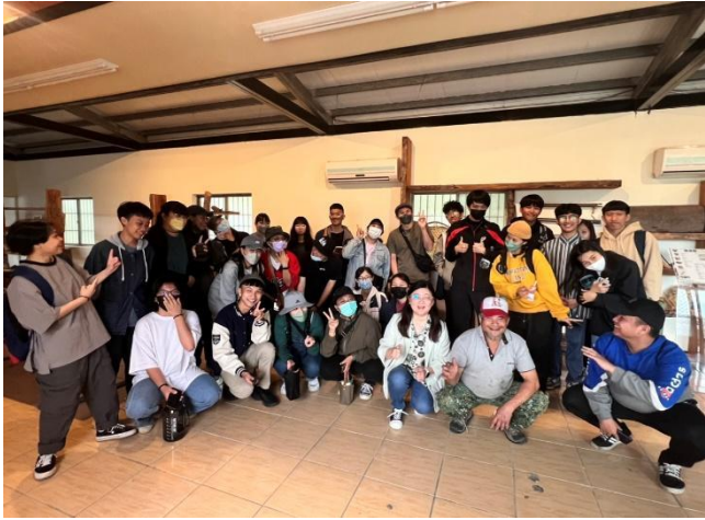
校外參訪，全體與文物館及獵人 Mimi 合影