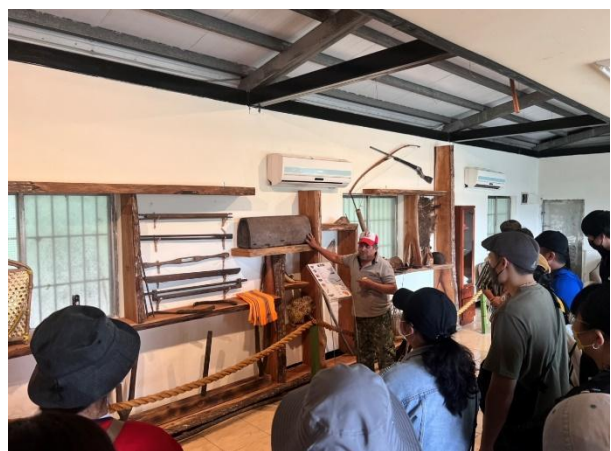
文物館導覽—太魯閣文物解說