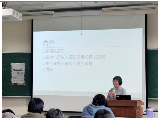
葉教授演講，理解認知語言學