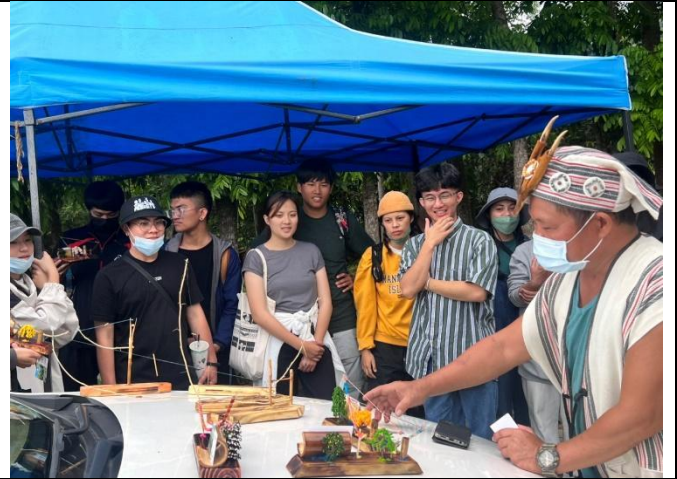
訪山活動結束後，有獎徵答