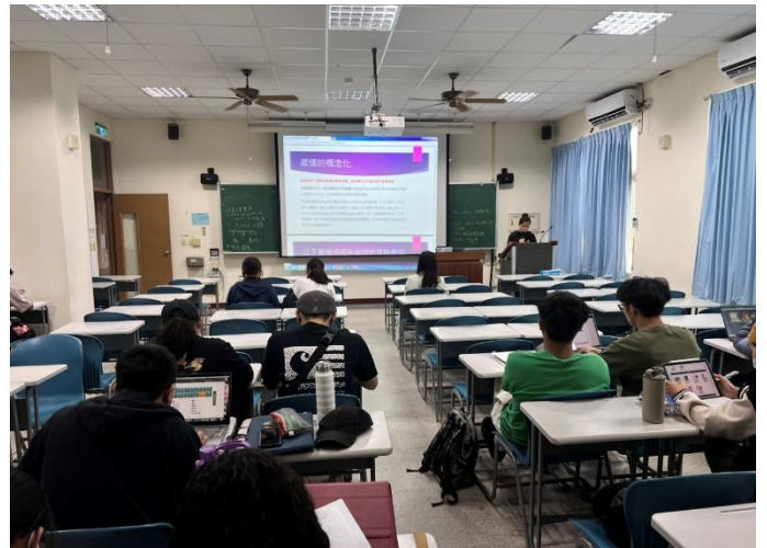
同學個人期中報告