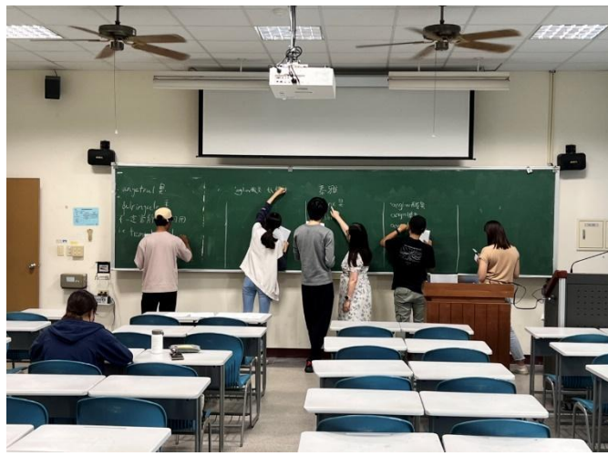
課堂老師帶領同學理解不同族語詞彙