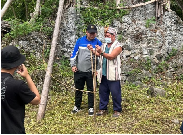
獵人戴明流解說陷阱作法並請同學體驗