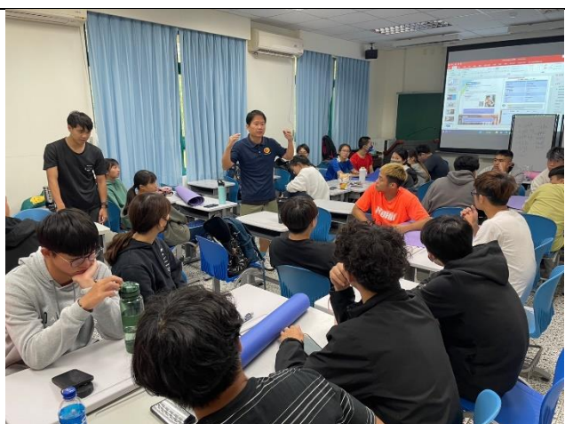
雙語體育教學工作坊武術訓練