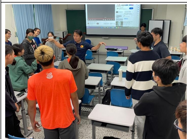
雙語體育教學工作坊武術訓練