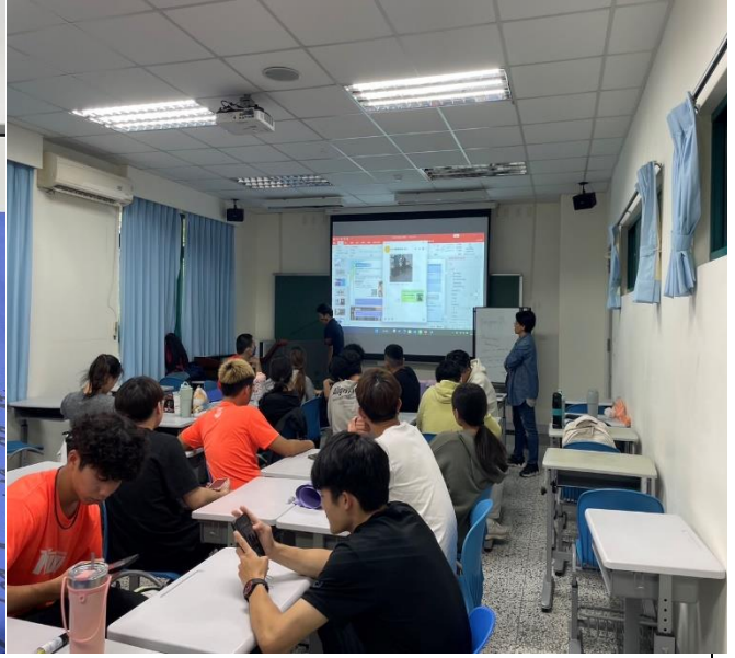
雙語體育教學工作坊表現型運動表現型運動武術的英語教學