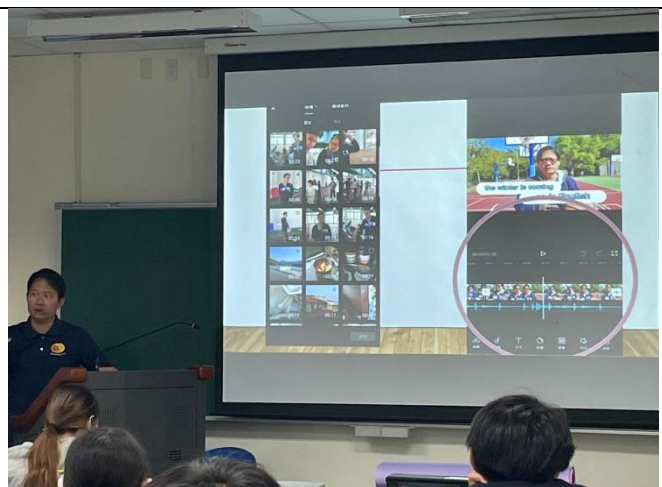
雙語體育教學工作坊剪輯教學