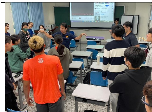
雙語體育教學工作坊武術訓練