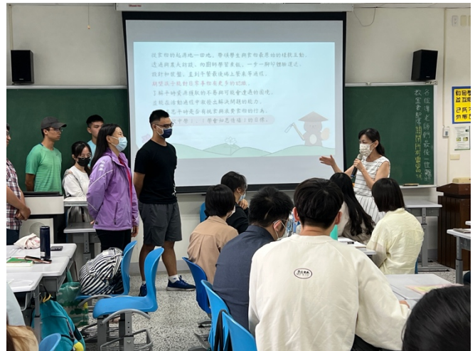
評審老師與上台分享的同學互動問答