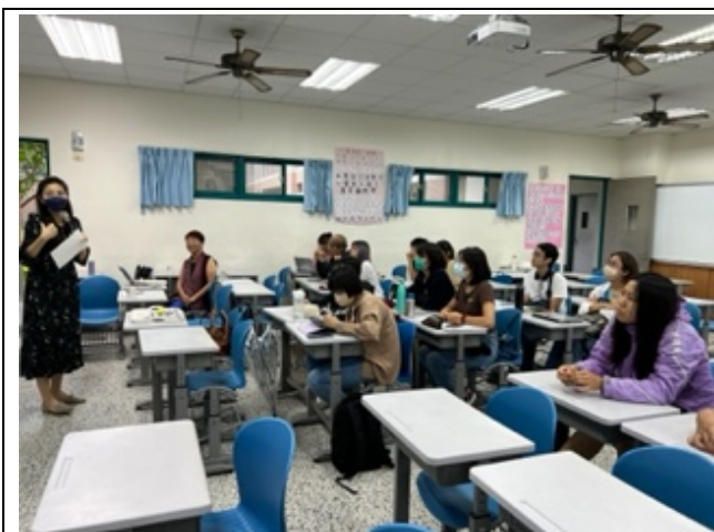
評審老師向台下同學講述期末計畫報告的可行性分析