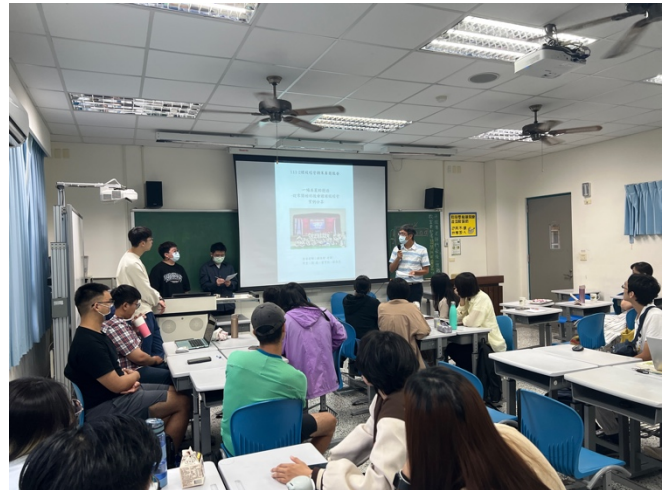
台上的小組全神貫注的聆聽評分老師的意見