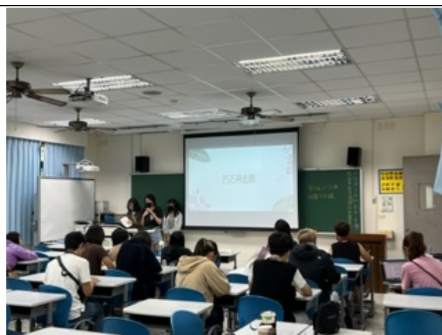
小組成員們向台下同學介紹他們規劃的班級經營主題