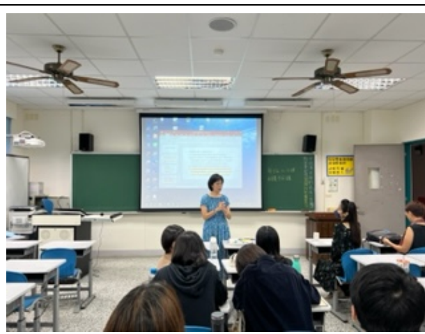
顧瑜君老師向同學們做期末分享的總結