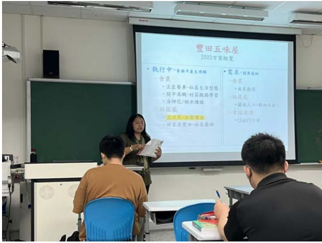
講師向台下同學講述社區教育機構—五味屋的方案計畫與階段性工作