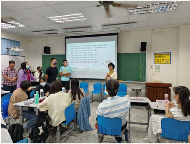
顧瑜君老師生動的為小組進行講評