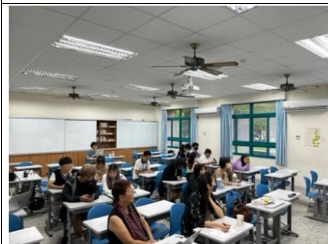
台下的觀眾專心聆聽期末計畫的內容