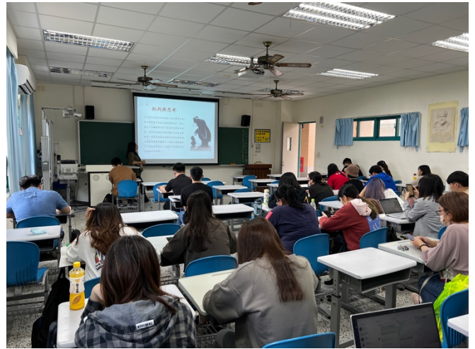
講師透過提問、經驗分享如何將玩的教學融入讓學生學習