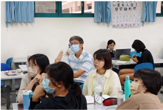
期末報告令人印象深刻，並丟下問題使觀眾進行反思