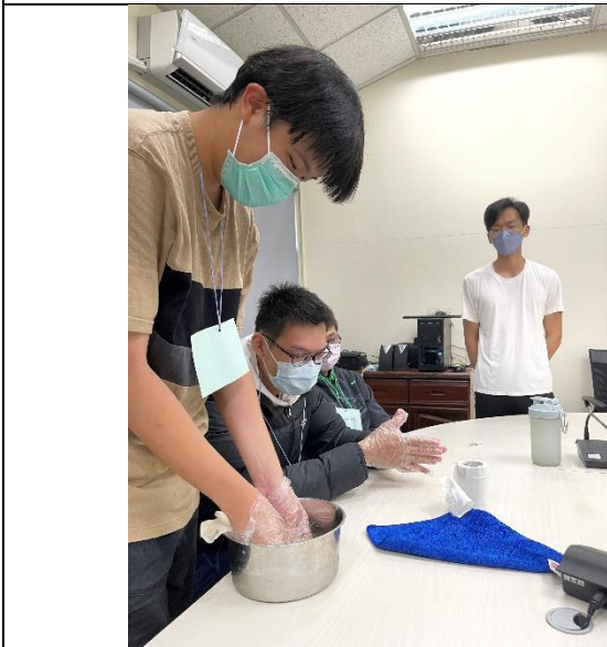
第五組小組活動-傳統愛玉製作