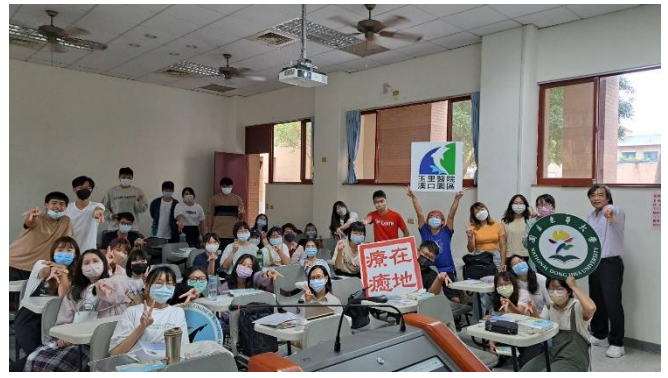
課程說明後大合照