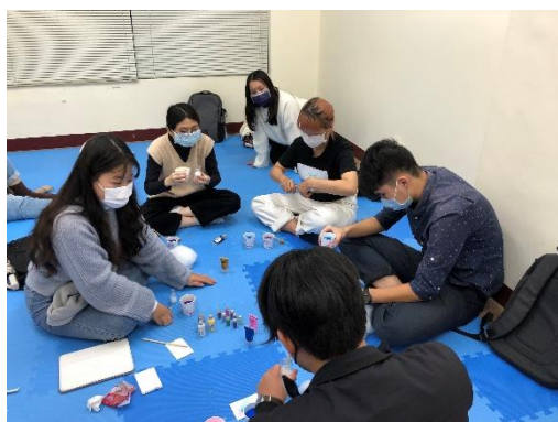
實踐課程-藝術療癒活動—星空瓶