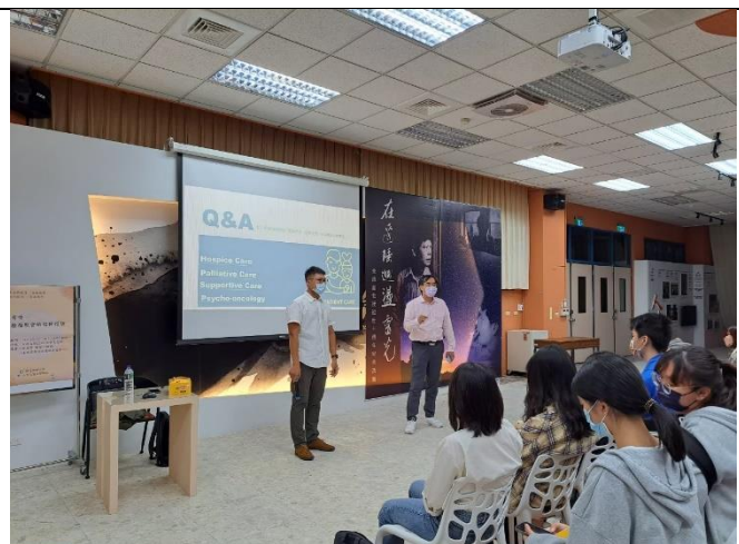
柳谷學臨床心理師回應同學疑問