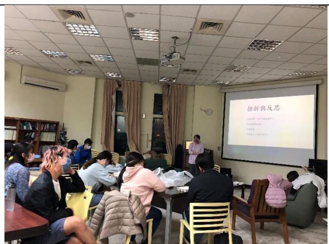
學士班同學分享實踐的挫折與反思