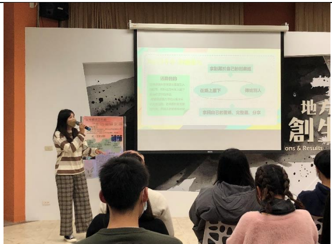
小組分享心理療癒活動設計