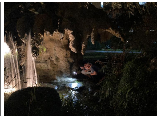
第二組小組活動-戶外探索