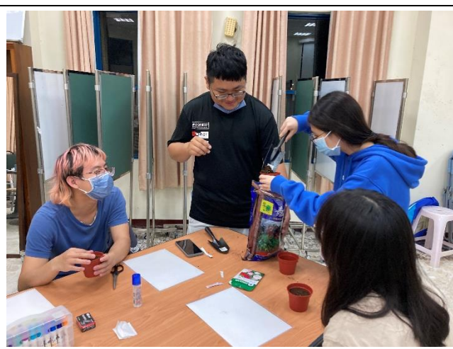
第二組小組活動-園藝療癒