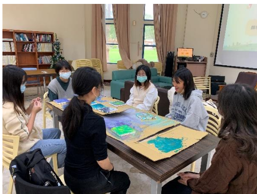
實踐課程-藝術療癒活動—流動畫