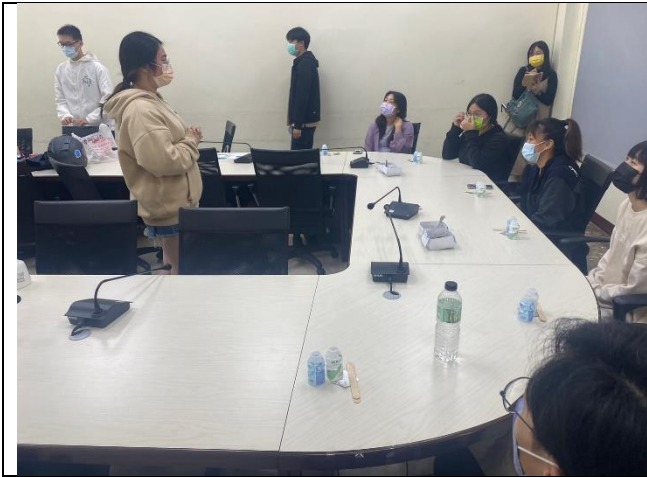
第三組小組活動-製作沙鈴