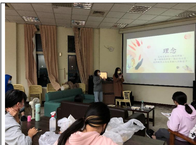
學士班同學分享過去設計並實踐的心理療癒活動