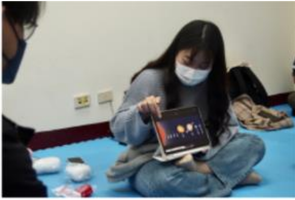
第四組小組活動-介紹星空