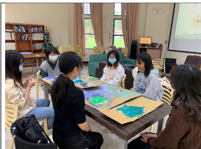
第一組小組活動-流動畫-作品分享