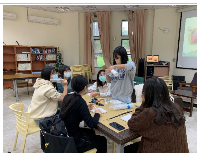
第一組小組活動-流動畫-講解者示範