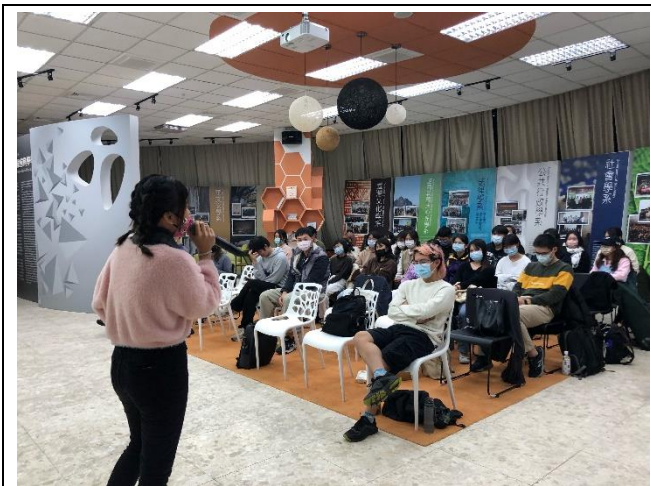
小組分享學習歷程與心得