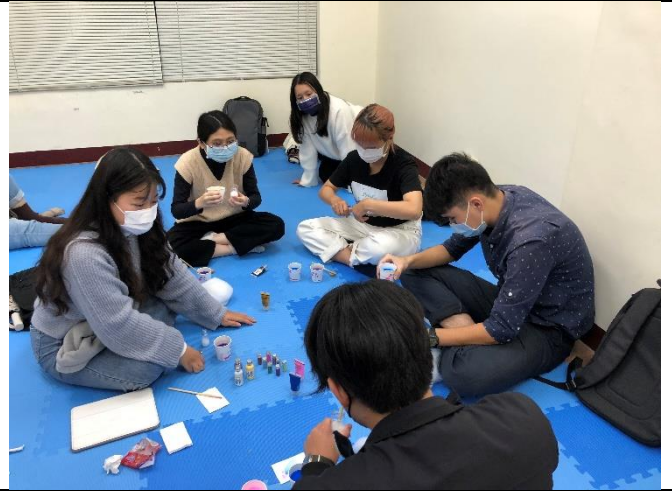
第四組小組活動-製作星空瓶