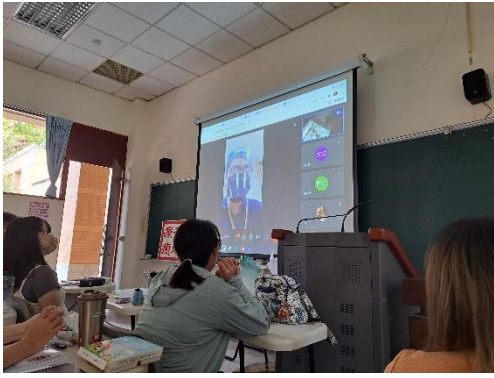
業師運用視訊介紹場地