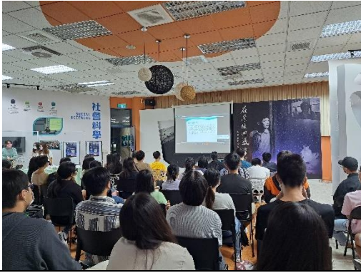
結合實體與線上進行講座