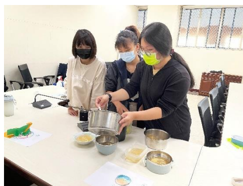
實踐課程-感官療癒活動—傳統愛玉製作