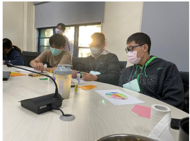
第五組小組活動-曼陀羅