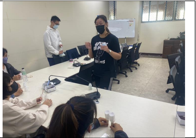
第三組小組活動-沙鈴帶動跳