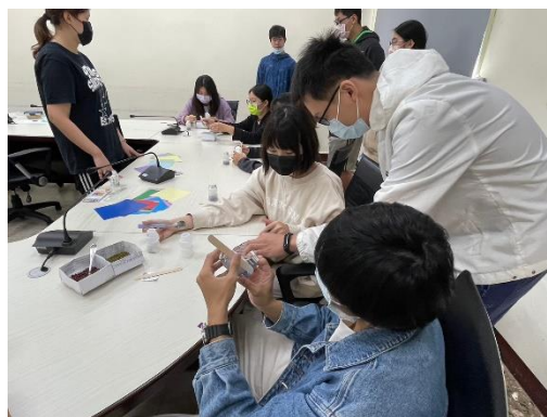
實踐課程-動態療癒活動-沙鈴 DIY