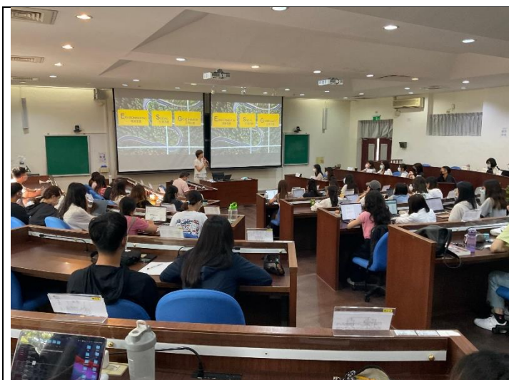
資誠事務所創意與創生 ESG 策略實務分享