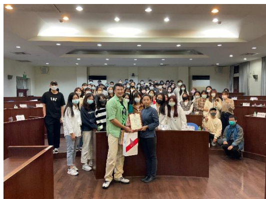
課程結合系友分享