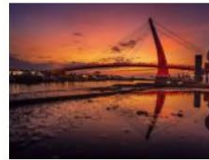
8 有緣無緣 都能流浪到淡水