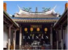
9 府城街巷，香煙裊裊