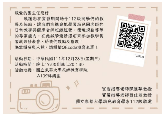
實習成果展邀請卡