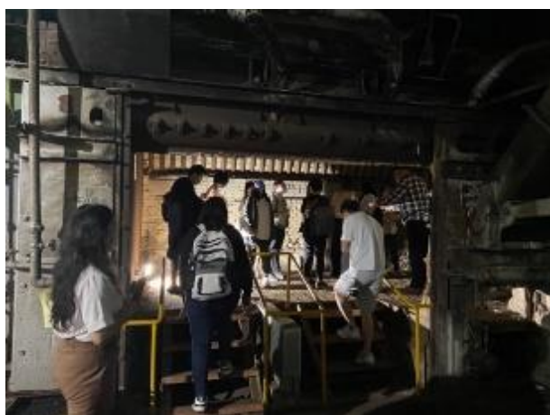
同學們參觀糖廠內部