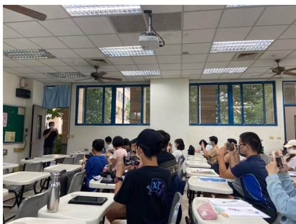
講者教同學如何使用手機掌鏡