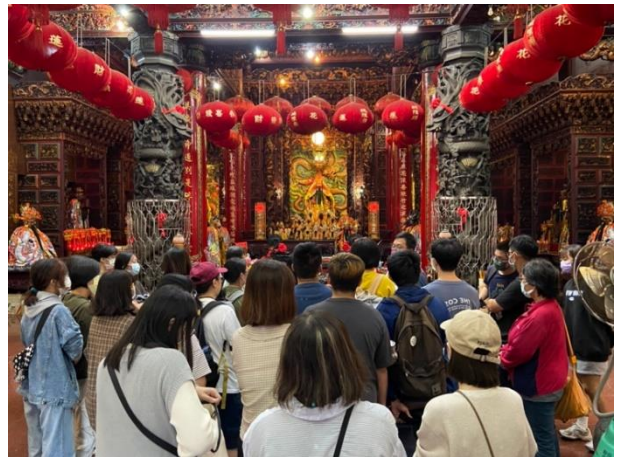
溝仔尾內走訪講解(花蓮城隍廟)