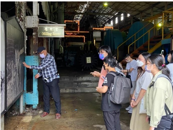
講解糖廠歷史及參觀壓榨室