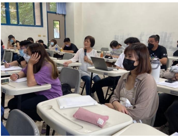
走入座位中與同學講解光華村歷史