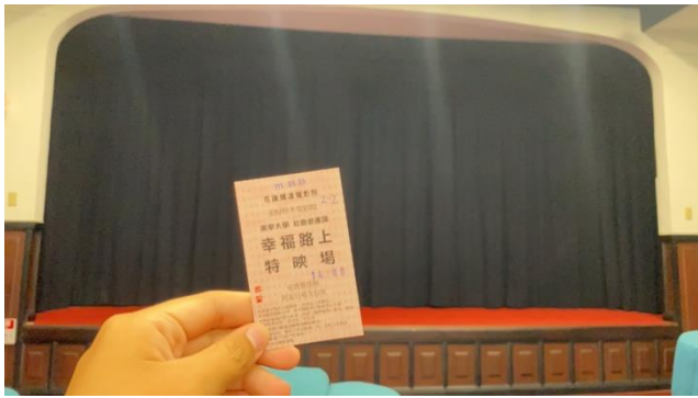
花蓮鐵道電影院特別設計的电影票