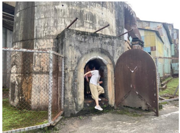
參觀糖廠煙囪底部