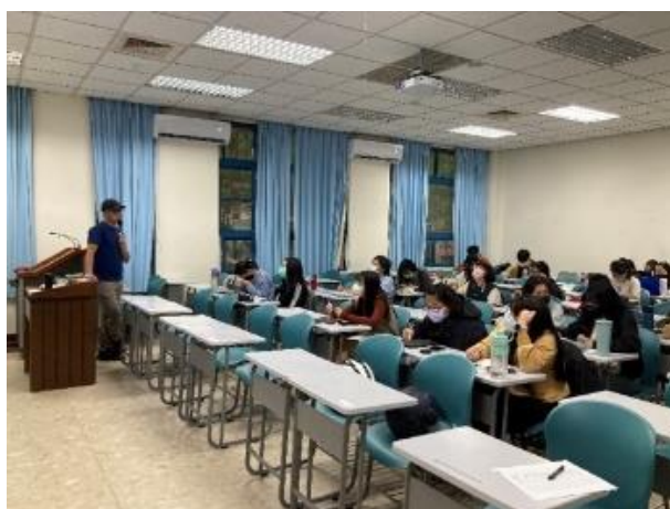
講者講解社工實務經歷