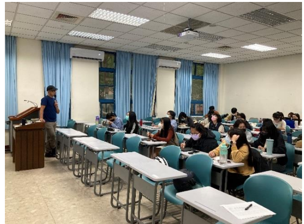
部落工作中實例分享