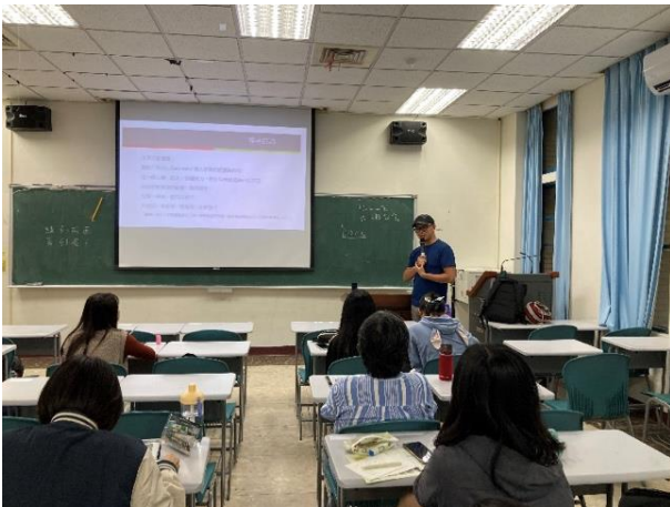
講者自我介紹與自身反思