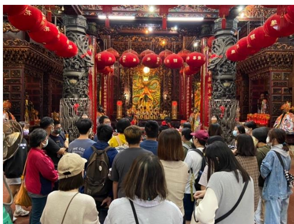
至溝仔尾的花蓮城隍廟參訪