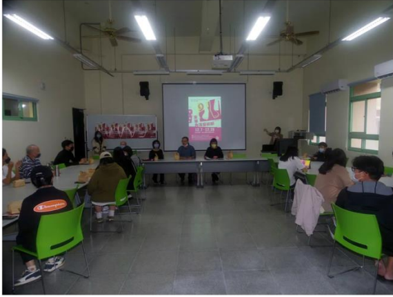
圖一：東華角落藝術節昨天舉行開幕典禮。

國立東華大學角落藝術節堂堂邁向第九年，昨天(十二月七日)下午在東華藝術學院舉行開幕式，這次主題「好九來藝杯」，取其諧音，如多年陳釀美酒，共襄藝術盛會！今年展出作品有六十件，展覽日期自十二月七日至十二月二十八日，藝術展團隊昨天配合製作推出藝術地圖，提供前往觀賞作品者可以按圖索驥，逐一欣賞六十件東華師生與校外師生完成的精彩作品。