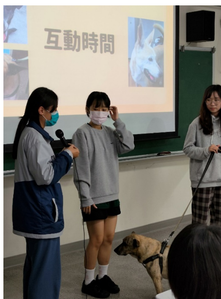
學生友善動物團隊「有毛氏」來課堂分享