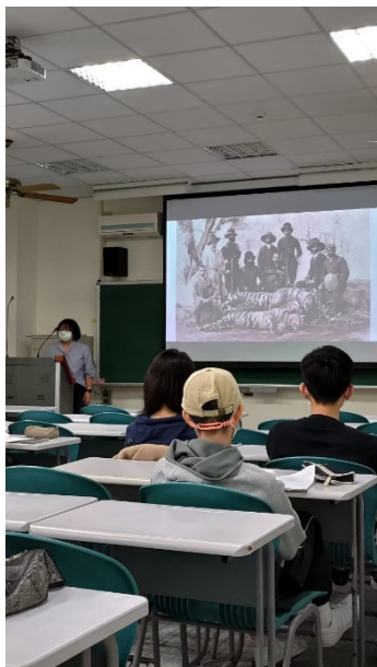
從凝視動物到動物電影賞析