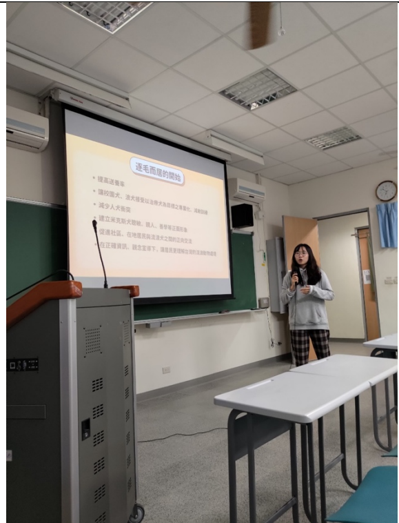
有毛氏的起點：我們為何開始？