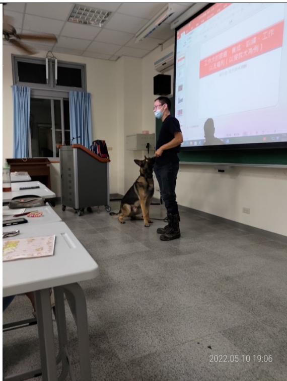
領犬員示範「服從訓練」，讓搜救犬等待訊號