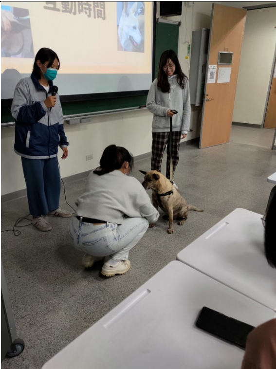
演講者引導同學如何與狗互動