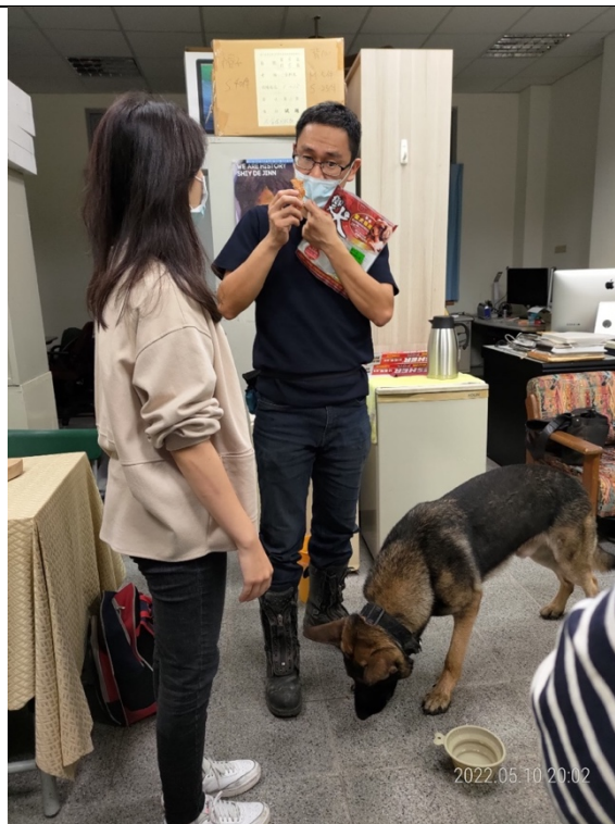
會後同學們與搜救犬的互動