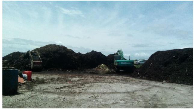
於花蓮垃圾掩埋場認識廚餘處理過程