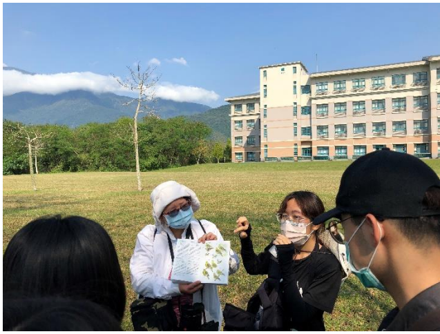
講者以圖鑑解說校園常見鳩鴿科