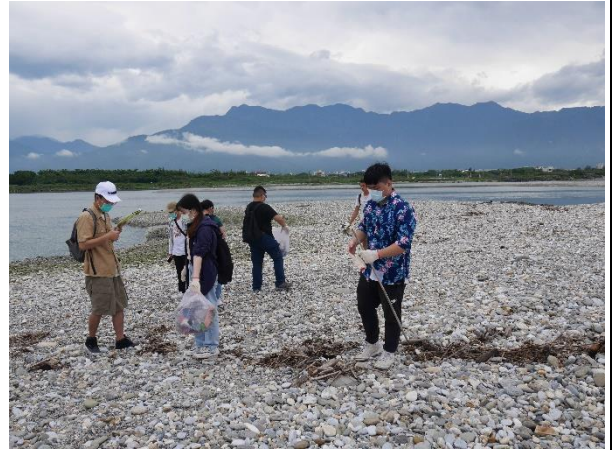
花蓮溪出海口淨灘