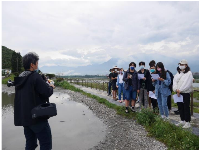
黑潮研究員解說淨灘原則和注意事項