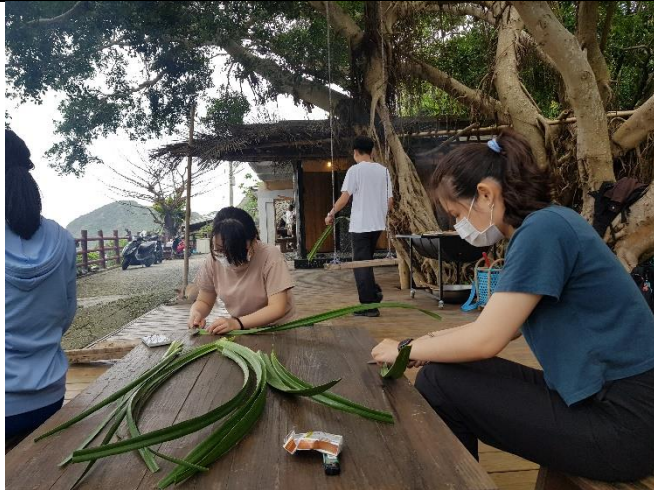
為拿來編織阿美族傳統食物阿里鳳凰的林投葉去刺