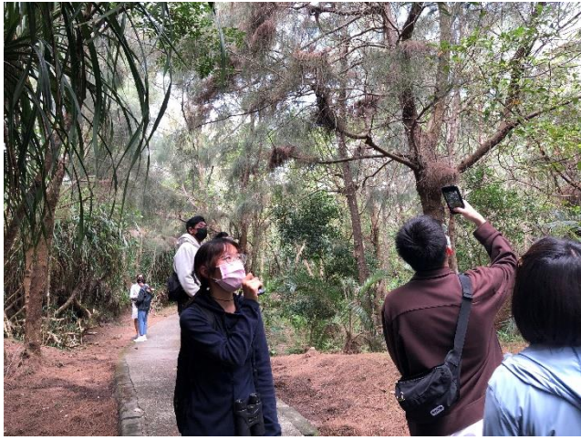
講者解說防風林第三層防風主力植物：木麻黃