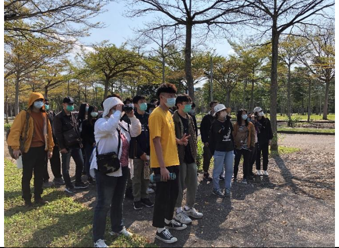
大家在東華校園尋找環頸雉