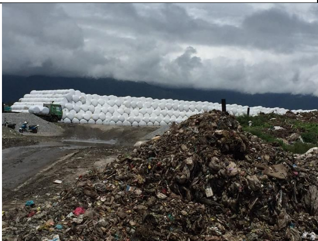
包裝成袋等待運送焚化的垃圾