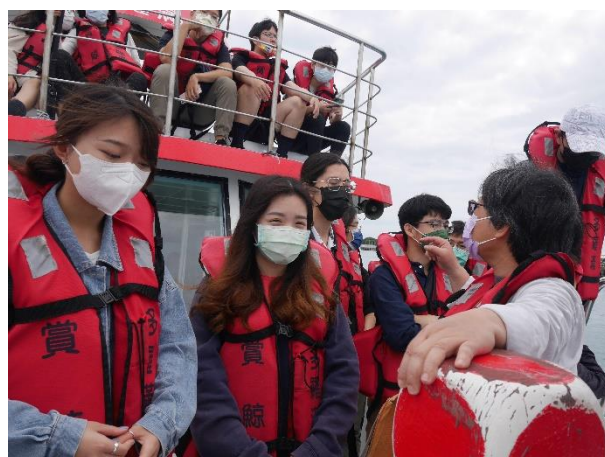
老師交代出海航程注意觀察海洋垃圾