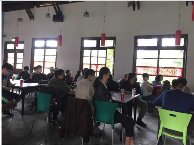
於海礦館聆聽行前解說