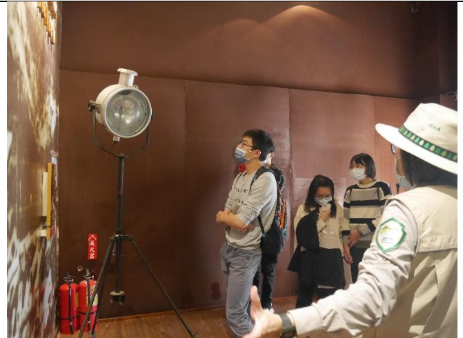
同學觀看林業陳列館內文物及老照片