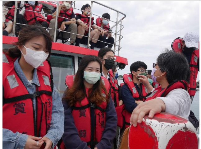
素梅老師提醒同學注意觀察海上垃圾