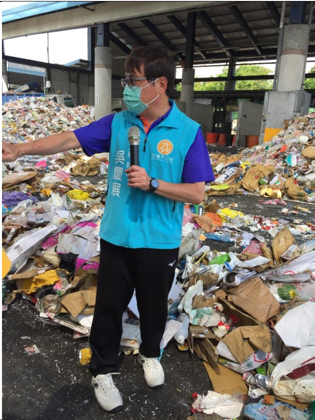
於花蓮市清潔隊聽隊長解說