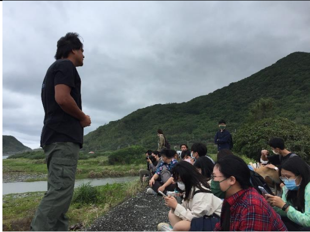
講者講解磯崎族群及作為分界的加路蘭溪