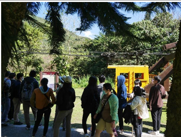
戶外林業遺跡—舊索道頭和流籠