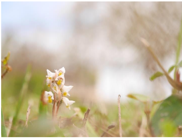
校園草地上正開放的線柱蘭