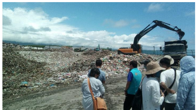
參觀花蓮垃圾掩埋場