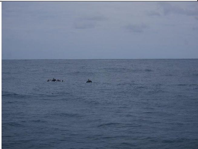
飛旋海豚成群出現