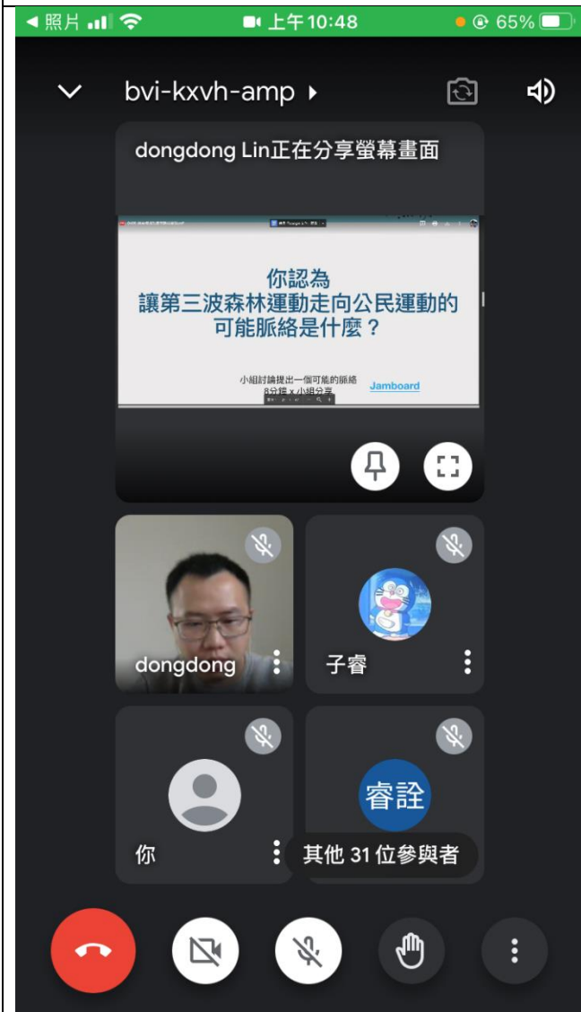
講者以提問方式帶領同學認識議題