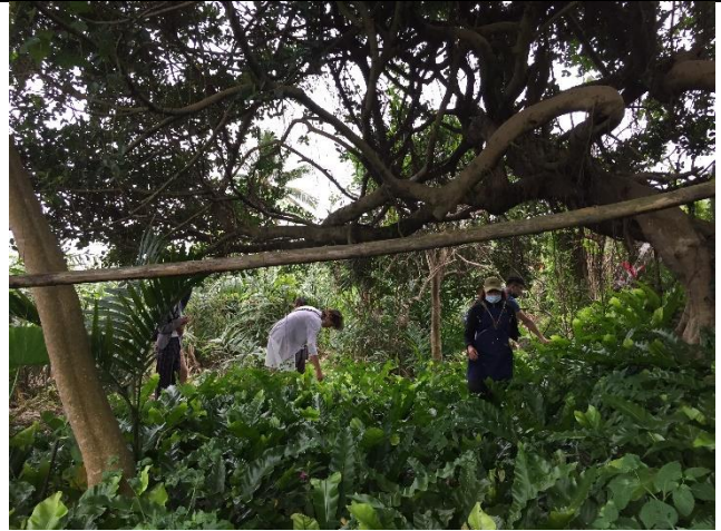
體驗摘採作為晚餐的山蘇