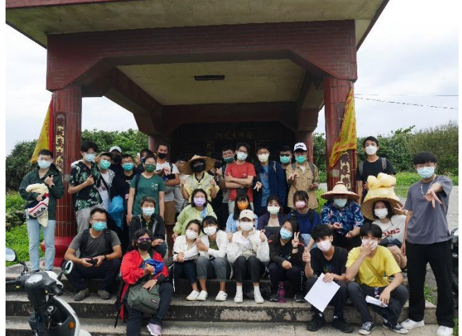
於溪口國姓廟大合照