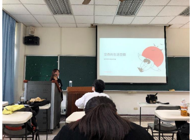
回到教室進行回顧、討論環境議題延伸思考