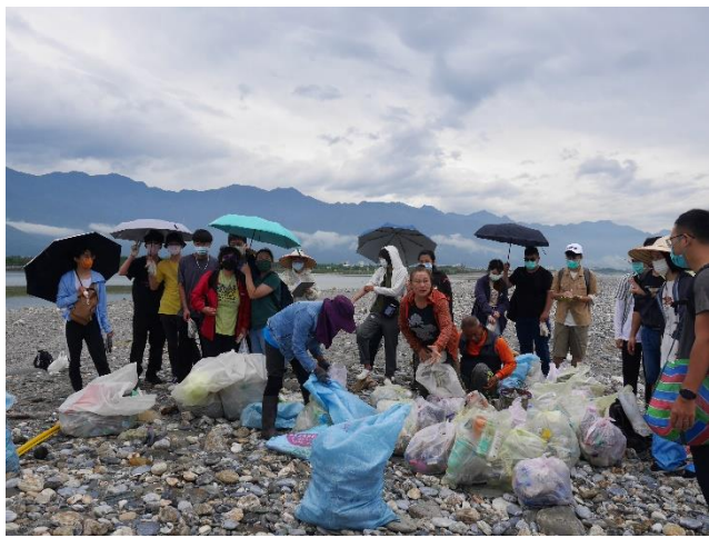
最終撿拾的垃圾成果驚人