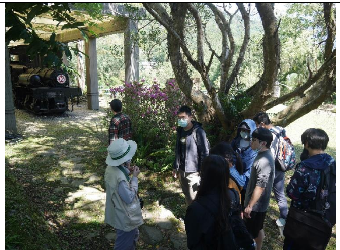
導覽志工介紹火車來歷