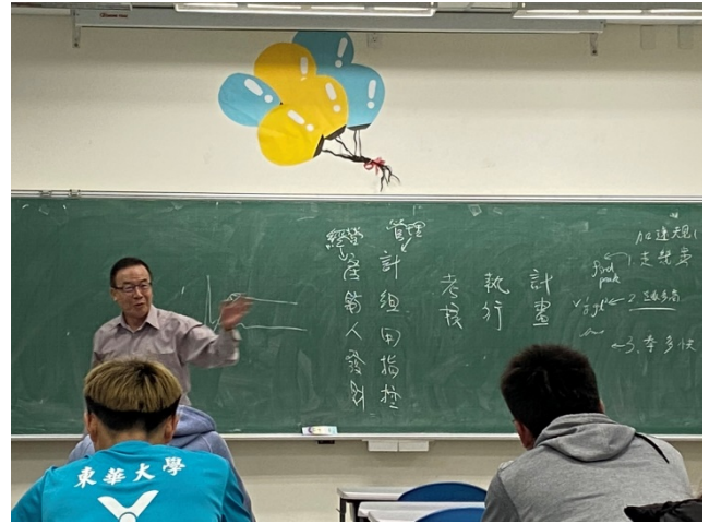
專題演講-運動學習成效的評量