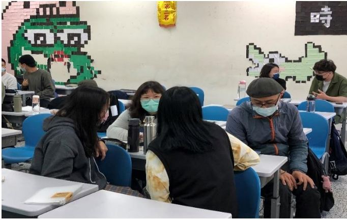
助教協助聆聽溝通演練