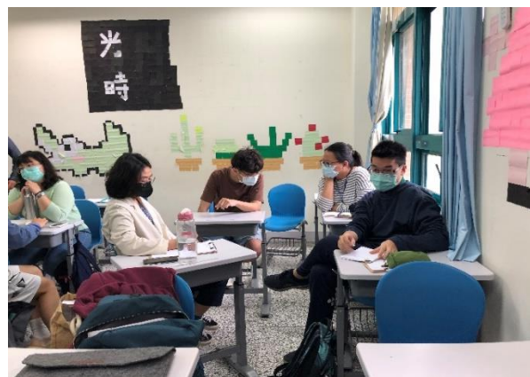
助教協助非語言訊息溝通演練