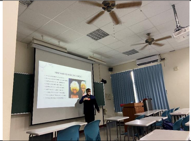
講者介紹圖片中髮色為天生並非後天染成。