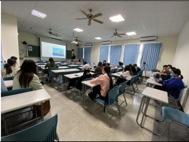
學生專心聽講側照。