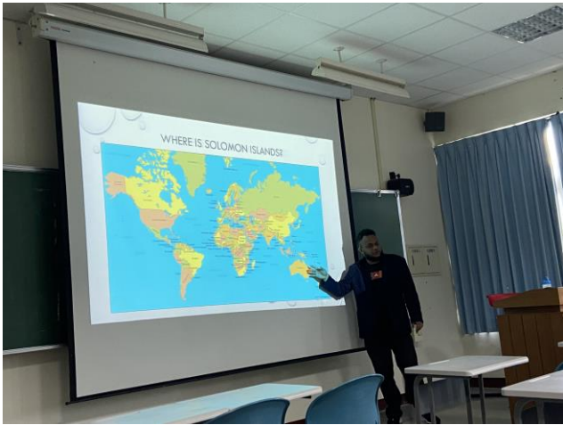
講者介紹其國家地理位置。