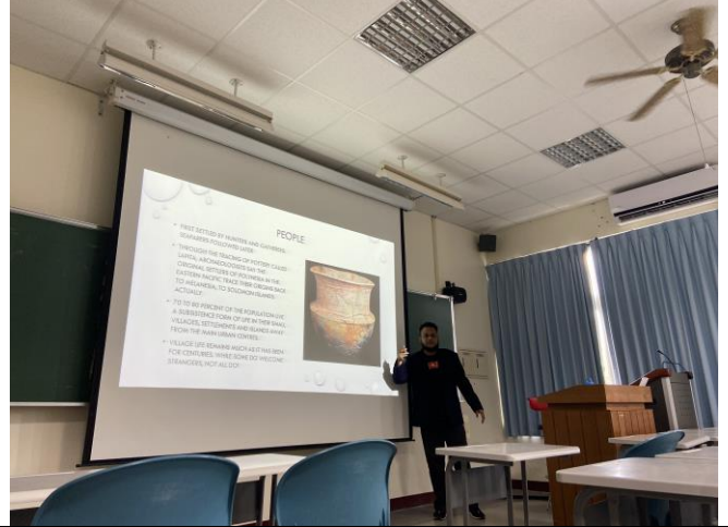
講者介紹其國家民族。