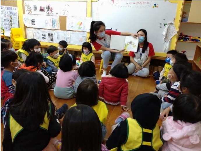
期中入園檢核表實作