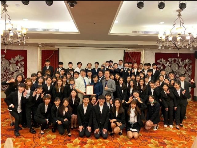
期末成果發表大合照