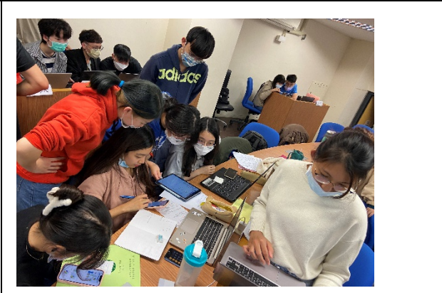
花蓮翰品總經理創意與創生 ESG 策略實務分享