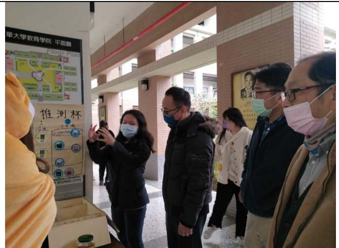
與參觀師生說明教具內容