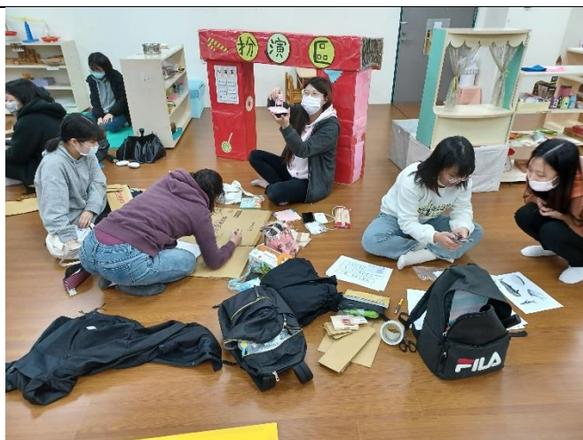
課堂中進行教具的實際設計與製作