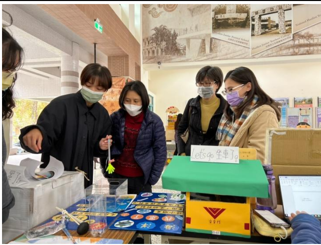
與參觀師生說明教具內容