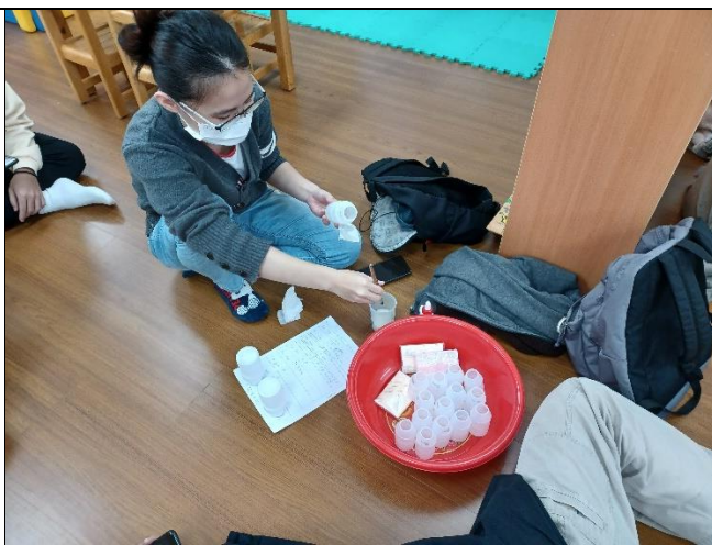
課堂中進行教具的實際設計與製作