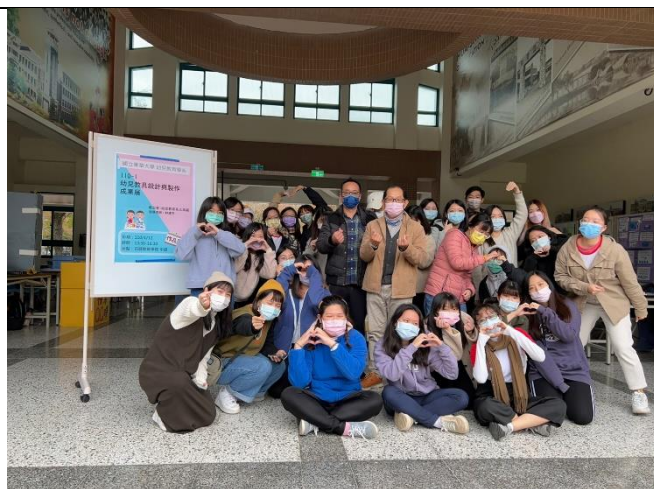
成果發表會師生大合照