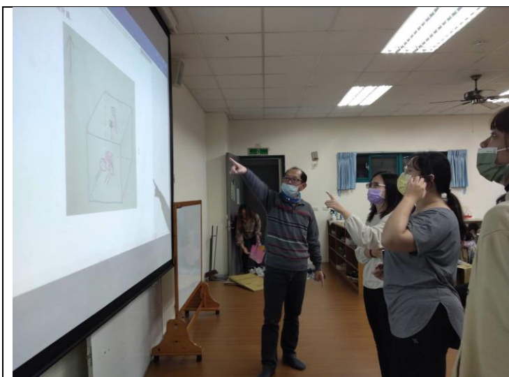
設計圖的評析與討論