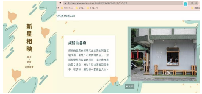
小組作品—新星相映