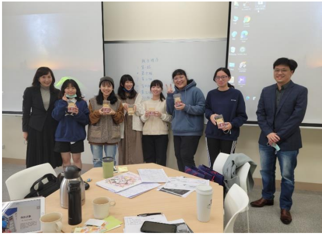
翰品酒店獎勵表現優良之小組