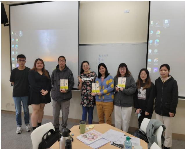
數位機會中心獎勵表現優良之小組