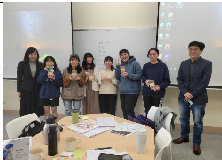
翰品總經理、經理參與期末成果發表，評獎鼓勵小組