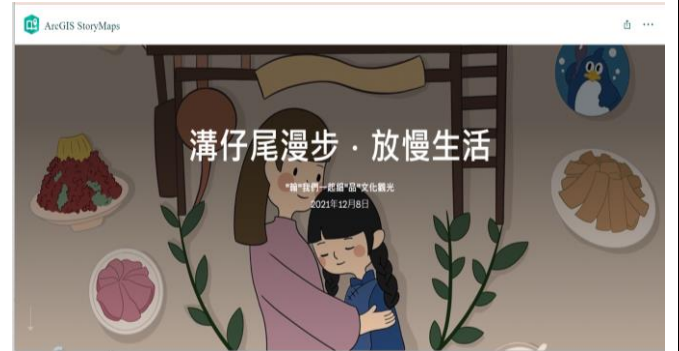
小組作品—溝仔尾漫步·放慢生活