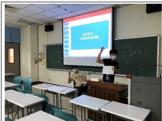
講者與同學進行失智測驗小短劇