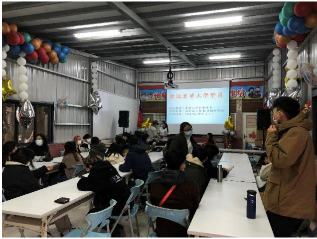
學生聆聽社區協會人員簡報