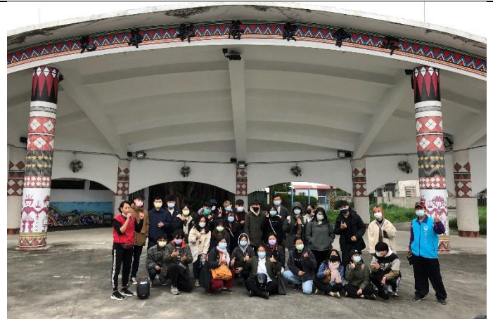
光華社區參訪時於社區廣場前合影