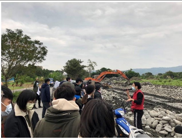
參觀社區綠照顧工程現場