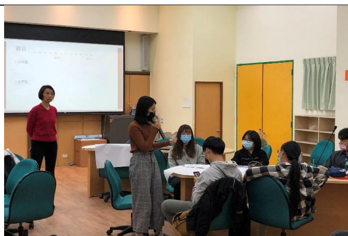
引導工作坊的小組成果發表