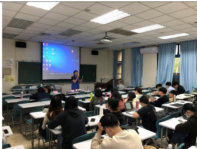
社區協會成員進行評論