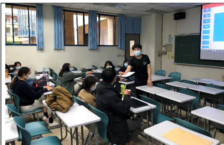
長照講座講者與學生積極互動