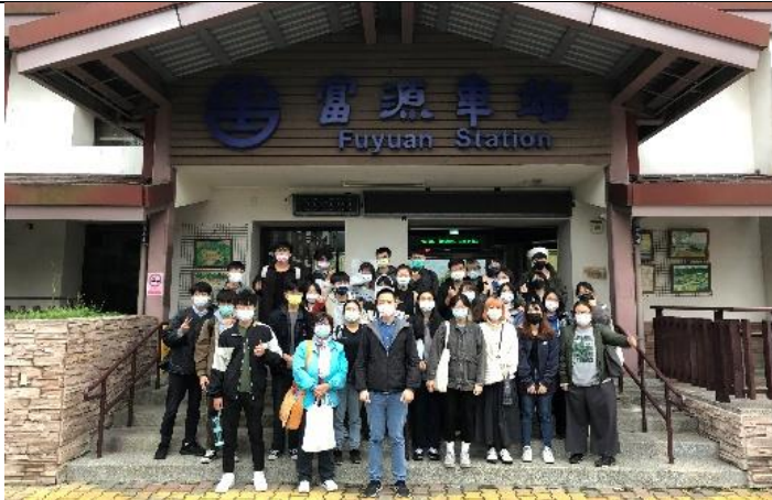
富源社區參訪時於富源車站前合影