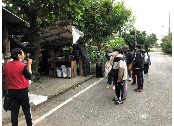
學生與地方長者互動