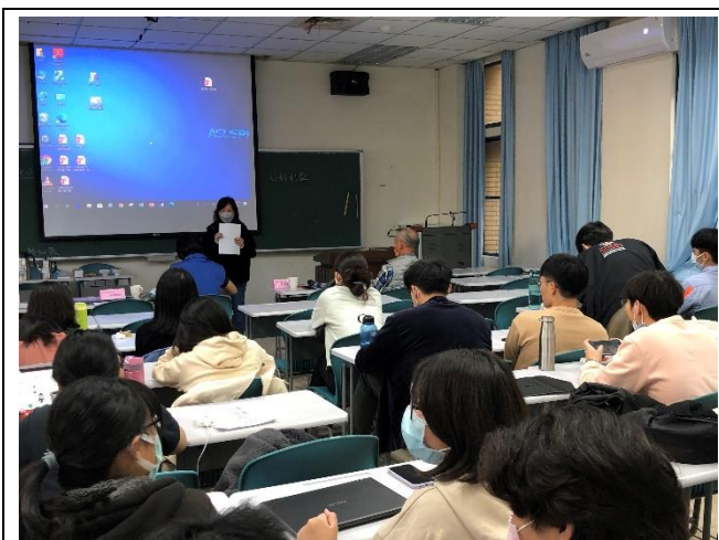
社區成員回饋學生意見