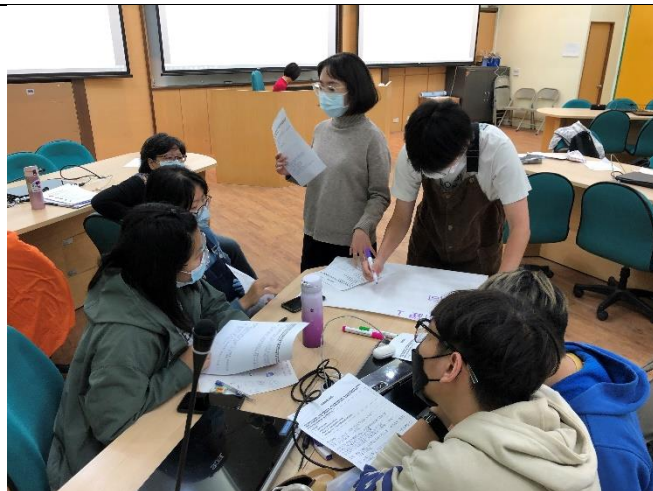
學生進行工作坊討論實作