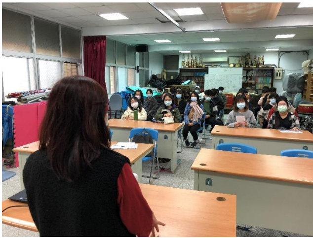
學生聽取社區協會簡報