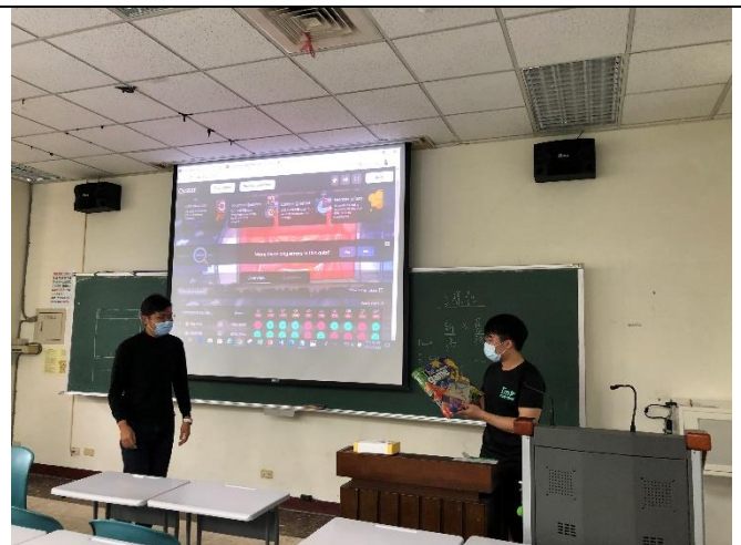
講者贈送互動教學遊戲贏家獎品