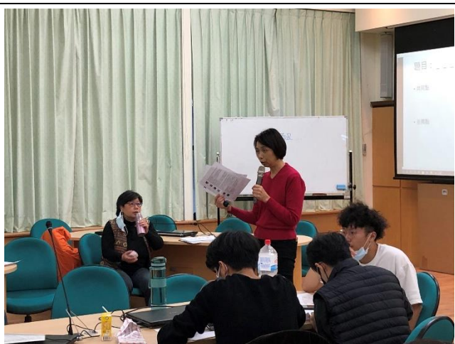
引導師簡報與概念介紹