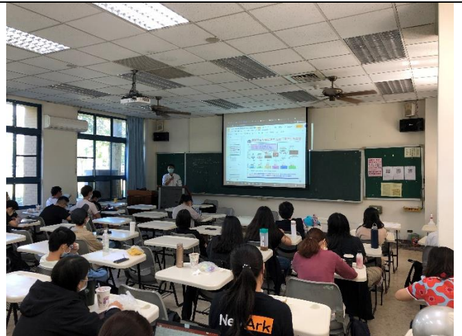
講者聆聽觀眾提問