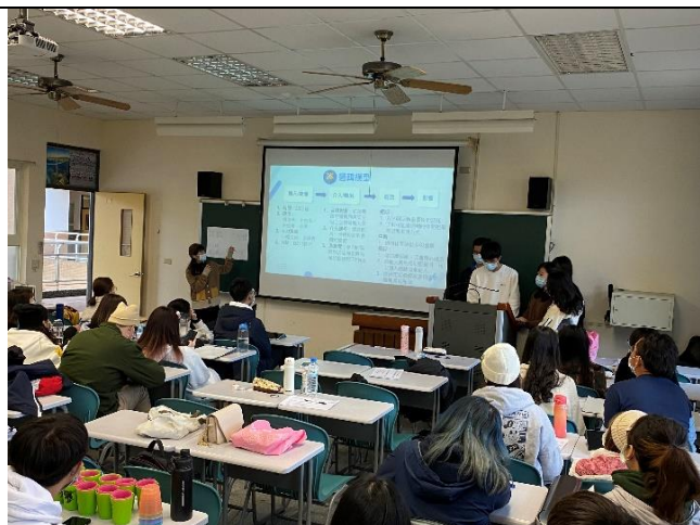
施行與實施階段：同學小組報告期末休閒教育計畫