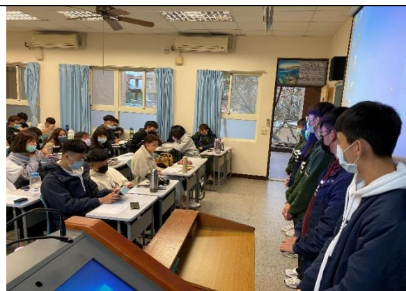
施行與實施階段：組間評量，每組同學意見回饋