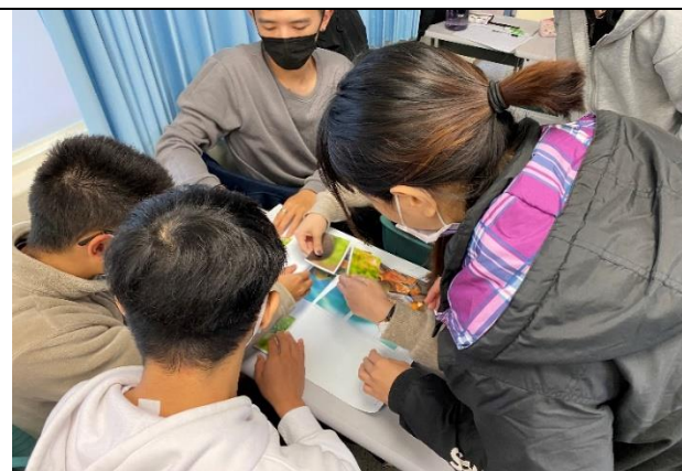
施行與實施階段：同學設計並帶領其他同學進行參與式學習