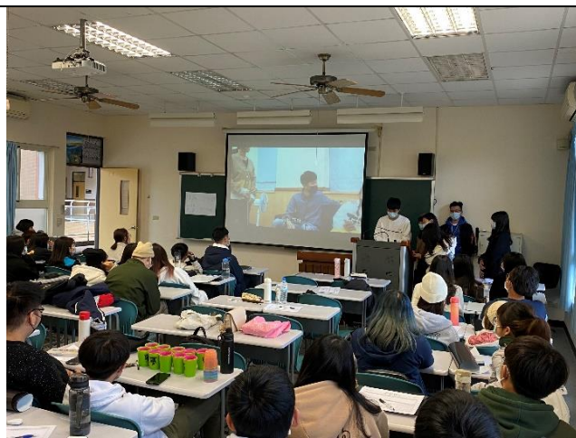
施行與實施階段：同學小組撥放休閒教育影片