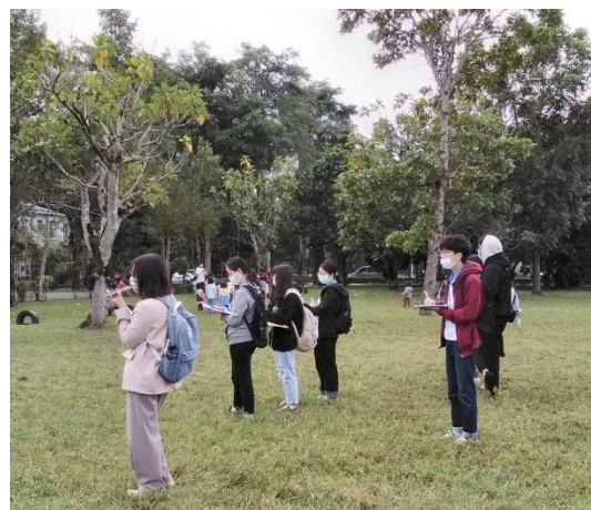
時間取樣法觀察過程