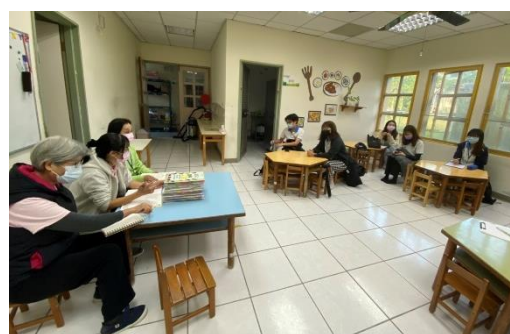
110/1/3 幼兒園教師與學生的專業對談