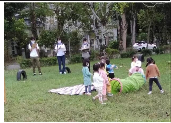
連續與樣本記錄觀察過程