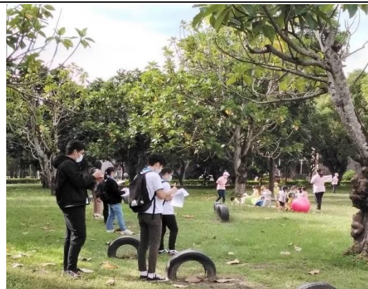
軼事記錄法觀察過程