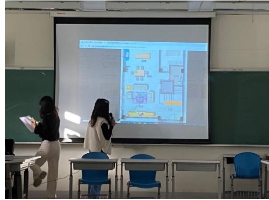
同學分享居家平面圖