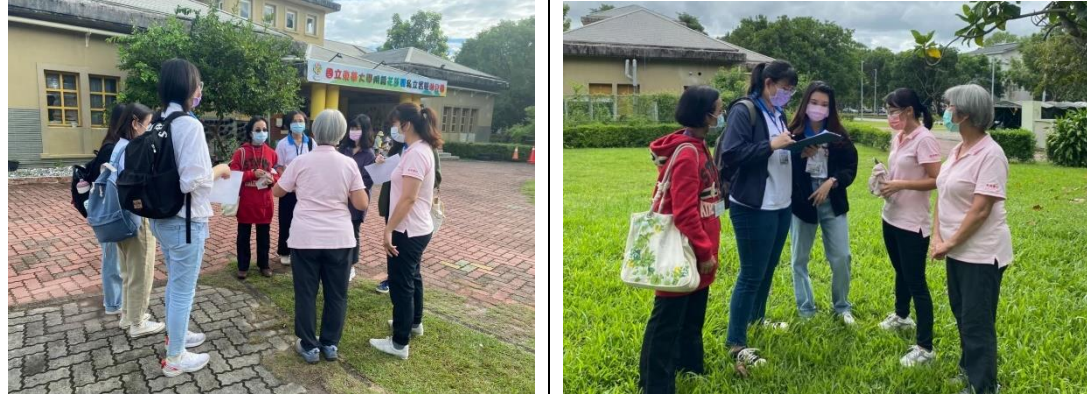
學生對幼兒園教師詢問有關觀察幼兒的問題