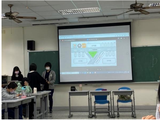
同學分享社區平面圖