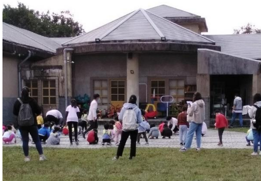
時間取樣法觀察過程