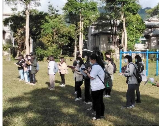
事件取樣法、查核表、評量表觀察過程