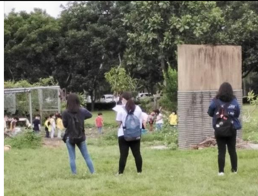
連續與樣本記錄觀察過程