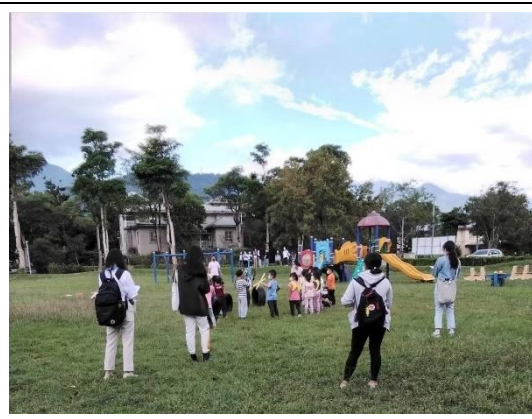
軼事記錄法觀察過程