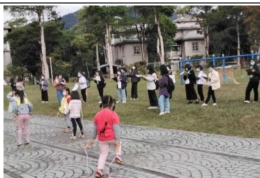
110/12/13 事件取樣法、評量表、檢核表