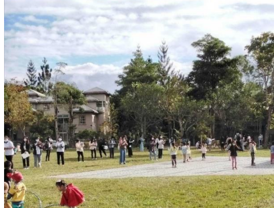
事件取樣法、查核表、評量表觀察過程