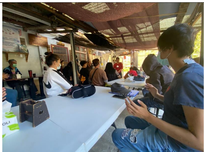
洛韶社區的深度關係人口分享音樂療癒法