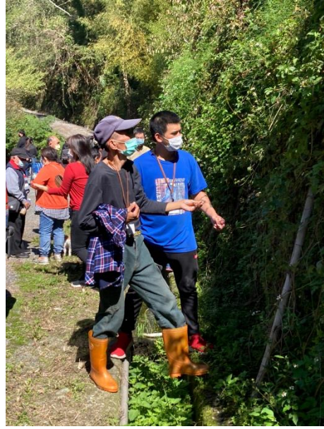
農田新作物啤酒花參觀