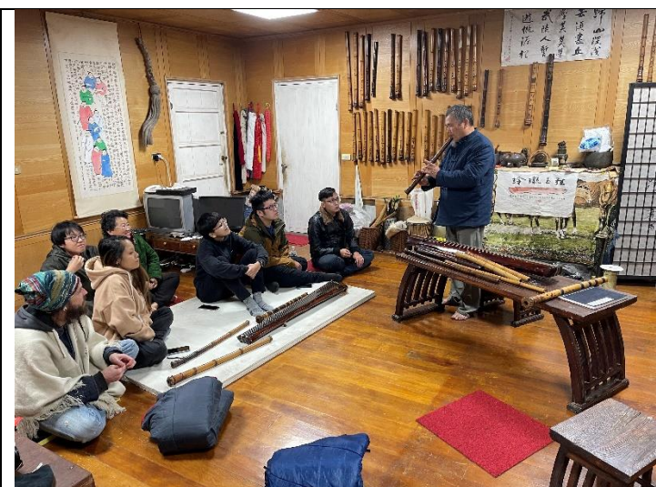
社區的洞簫師傅教授吹簫技巧