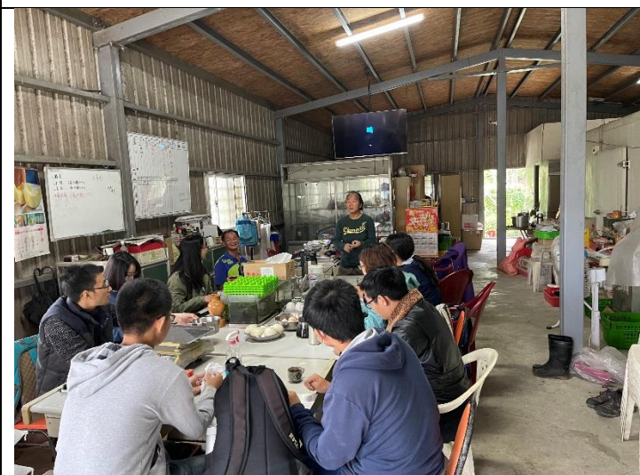
秉達農場分享有機轉型、畜牧業經營甘苦談