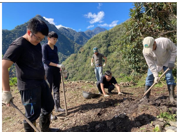
在海拔超過 1200 公尺認是高山農業協助農友整地