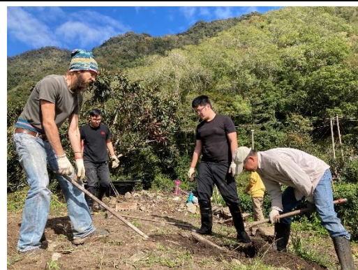
協助居民整理露營場地