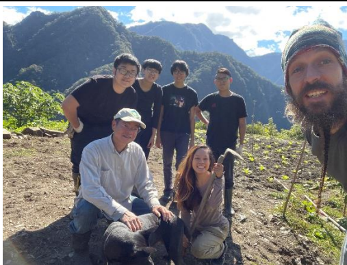
協助居民整理露營場地