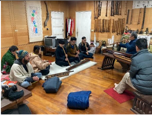
山村樂器製作師傅講解製作與吹奏