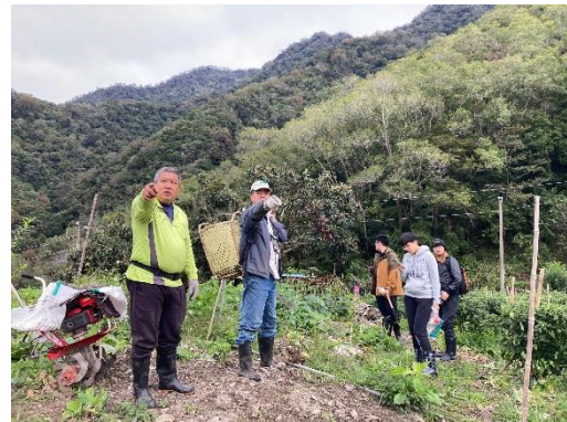
協助居民整理露營場地