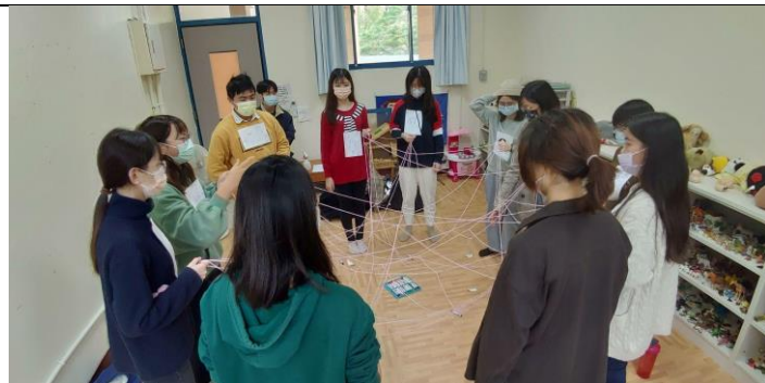
建立信任的繩結，有共同承擔與保密的寓意。