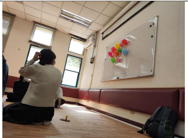
成員將焦慮比喻為氣球，正在討論如何呵護它，與它共處