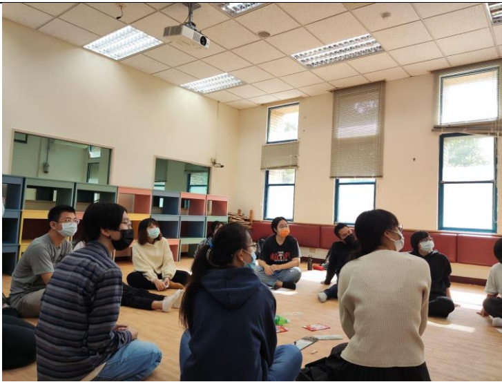
成員認真的在聽講