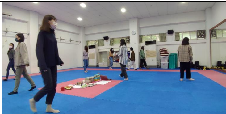
練習正念靜走，感受環境與自我，紓解壓力。