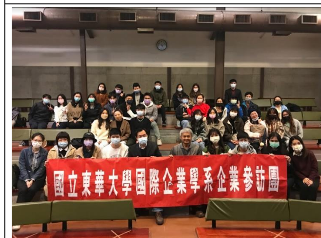
至標竿企業進行參訪