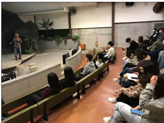
企業參訪講師分享創業經歷