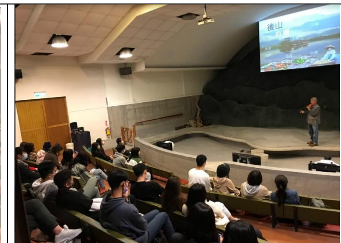
業界講師分享實際創業經驗