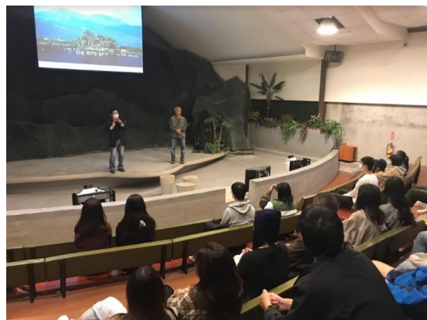
業者與學生透過問答交流