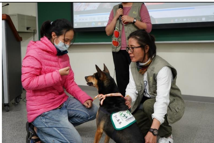
輔療犬與課堂同學互動