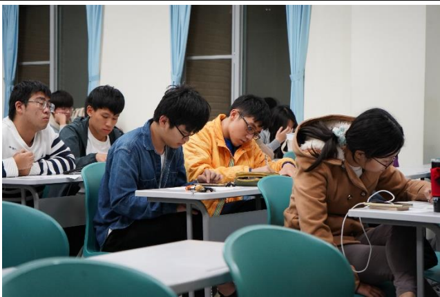
專心聽講的同學們