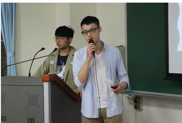
路殺社幹部們分享理念