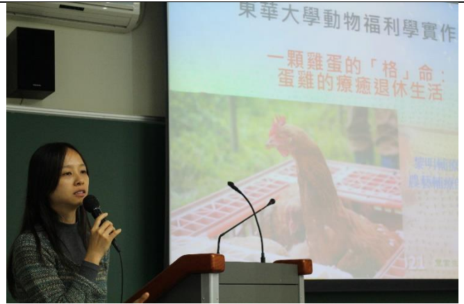
以一顆雞蛋的「格」命開場