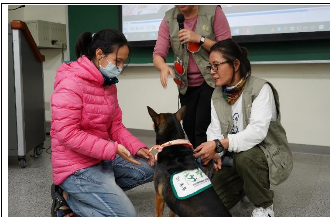
同學與治療犬互動