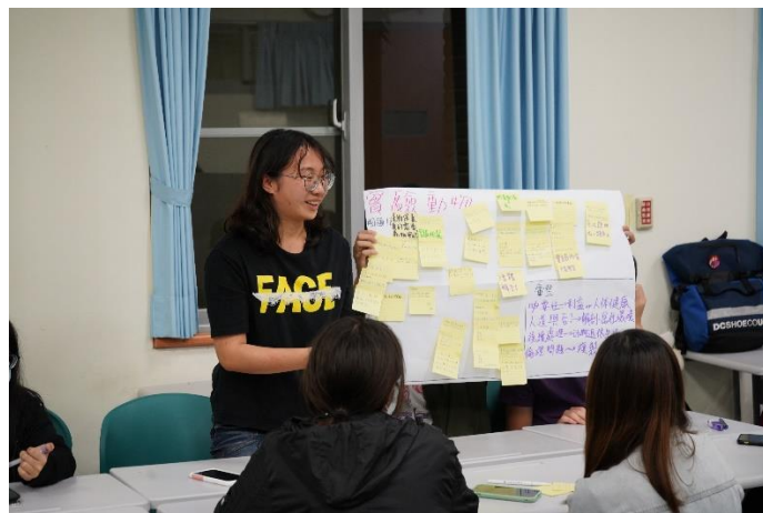
同學發表小組討論成果