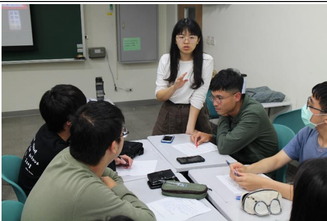
小老師一起參與討論