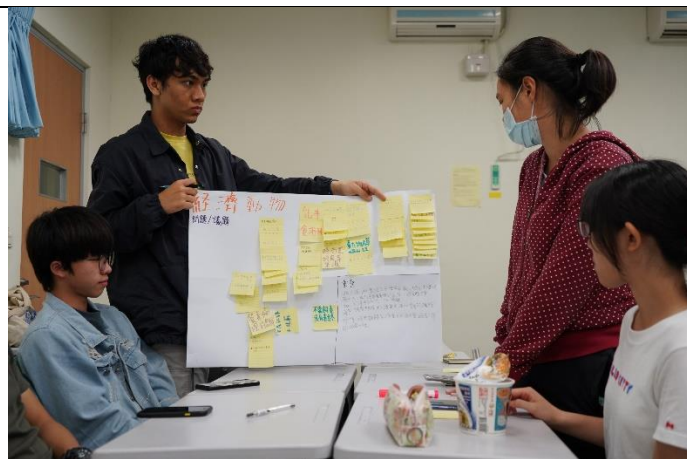
課程討論成果分享