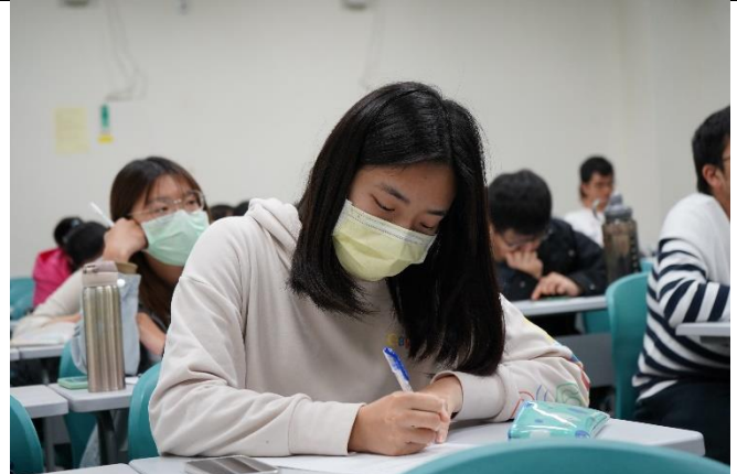
同學們認真作筆記