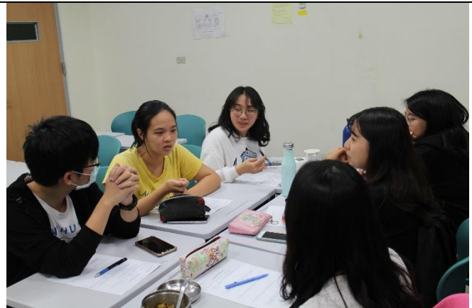
同學小組討論交流想法