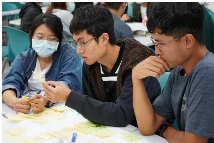
課堂分組促進不同科系的同學跨領域交流想法