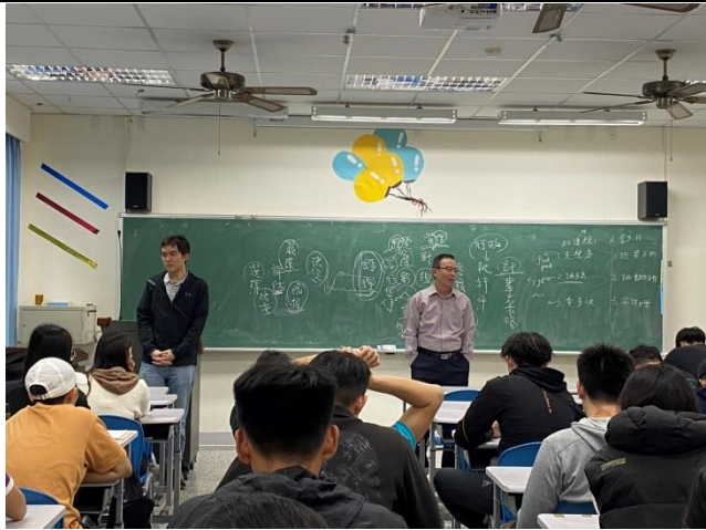
由徐偉庭老師開場，介紹吳國銑教授的經歷