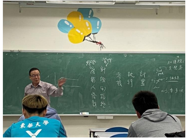
專題演講-運動學習成效的評量