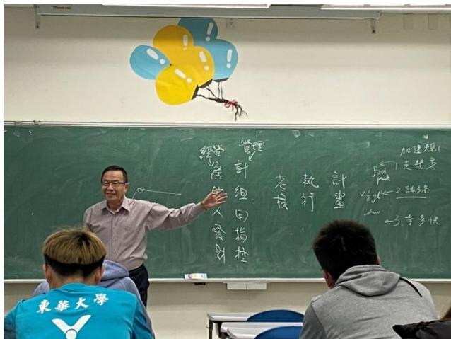
分享管理的幾要點，讓在座學生能夠加以運用