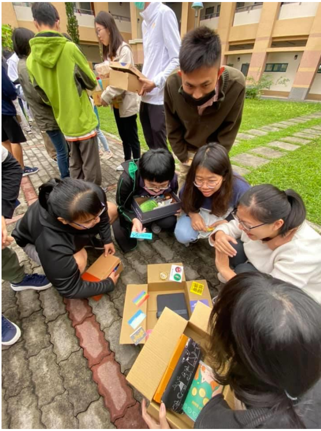
換物活動進行時，學生進行交流