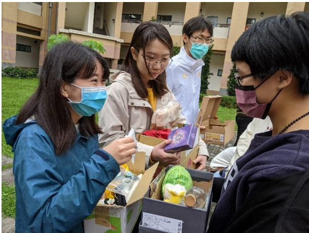
鞋盒換物：二手物交換體驗