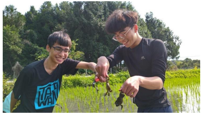
除草時的田間特別經驗