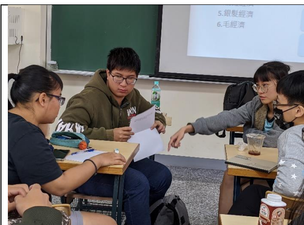
消費拼盤：分桌討論