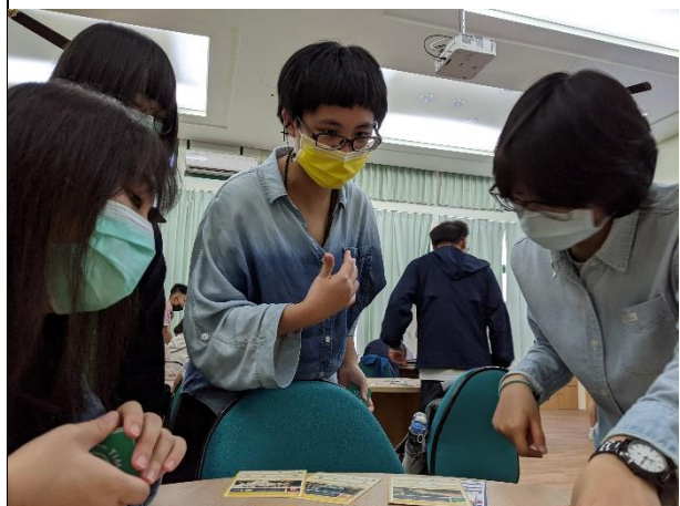
世界十年後：SDGs 桌遊體驗