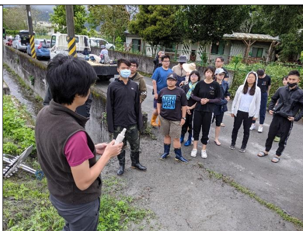
壽豐援農：小農解說田間生態