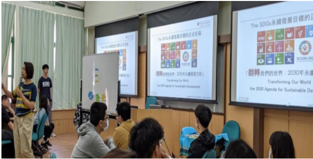
講師介紹 SDGs 精神