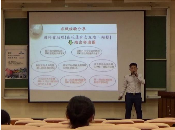
實務演講影片觀賞(1)