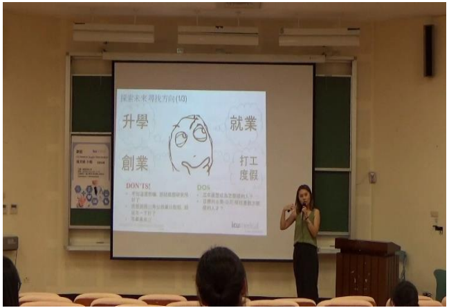
實務演講影片觀賞(2)