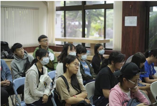
一大早騎到黎明向陽園聽講