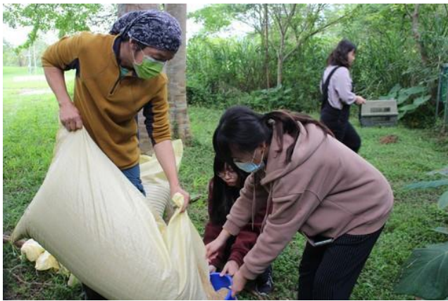
同學們分送舒適又鬆鬆的米糠到蛋箱