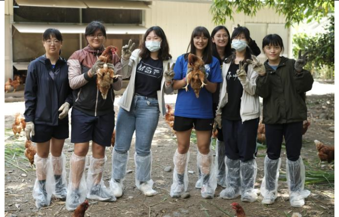
同學與雞群適應良好