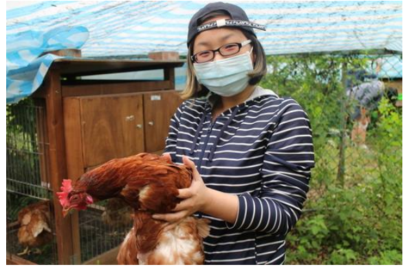
修課同學開心的抱著雞老師