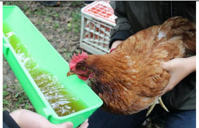
雞老師入厝吃甜甜