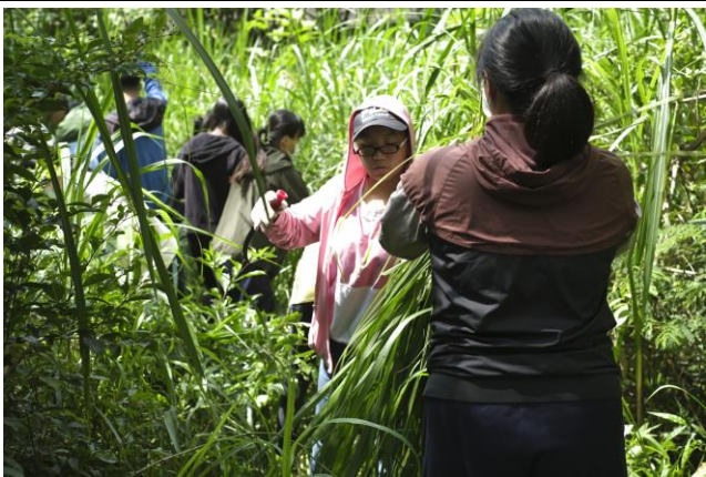
同學們分送割好的牧草