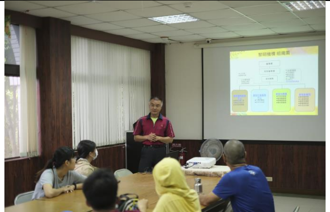
園長很認真地講解向陽園的故事