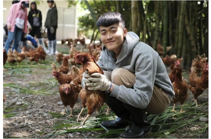
同學開心地抓著雞，和樂融融