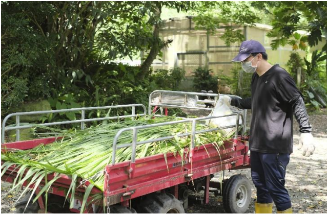
大家合力搬運的牧草堆