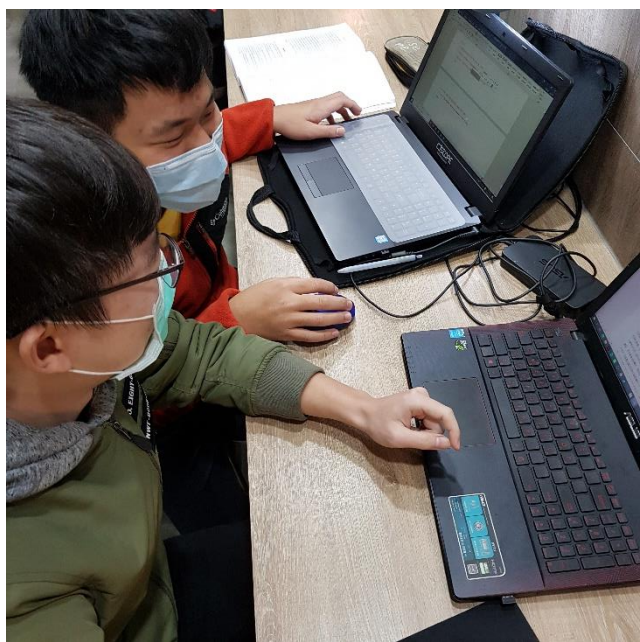
模擬做團體計畫回饋分析