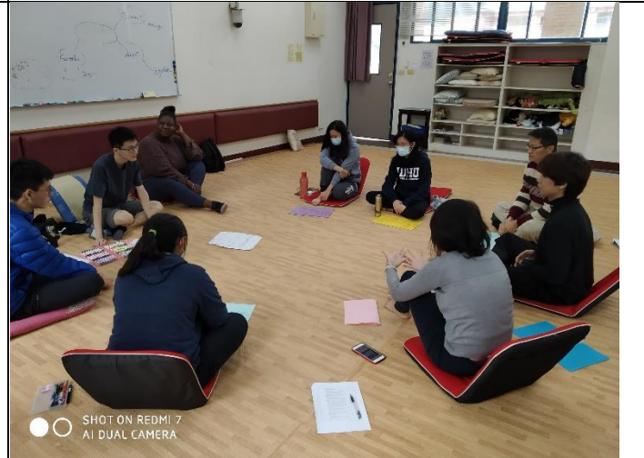
成員繪製壓力成因心智圖