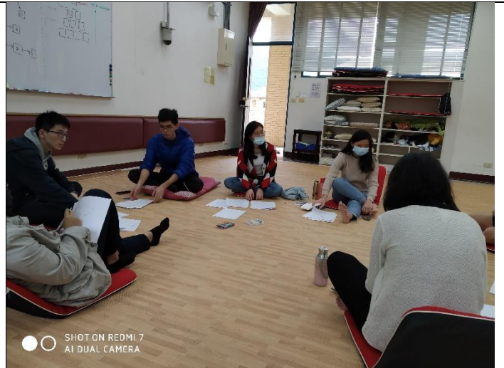
成員認真嚴肅的討論氣氛