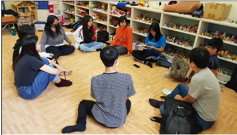
助教給予團體帶領後之回饋建議