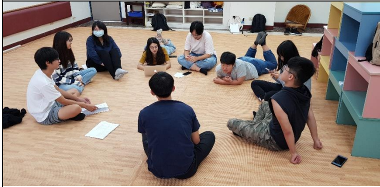
課堂休息時間，仍忘我討論剛才之團體歷程