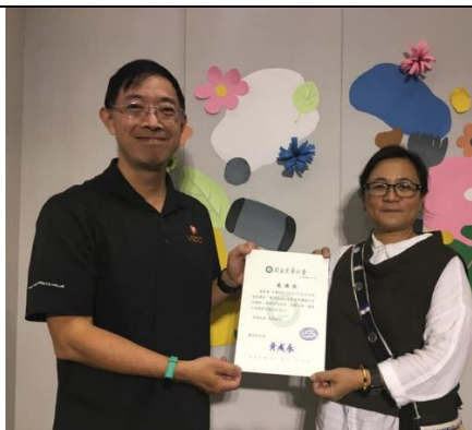
頒發感謝狀給導師