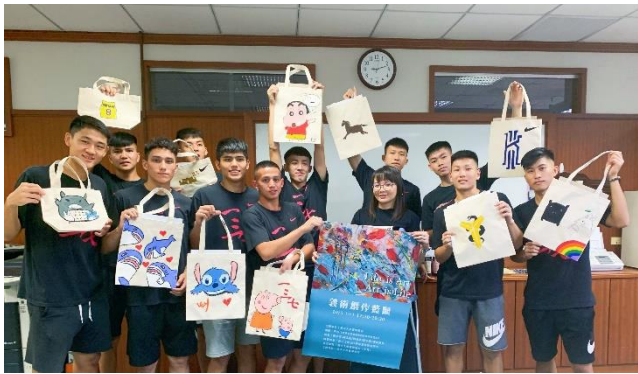
成品合照（資源教室學生不願意露出，大合照僅提供學生自行保留）