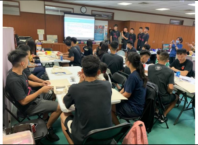
上課前講師使用 PPT 講解課程內容與將要進行的活動。