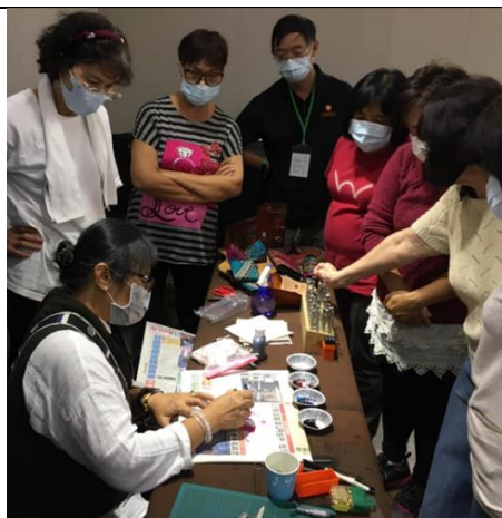
學員觀看導師示範