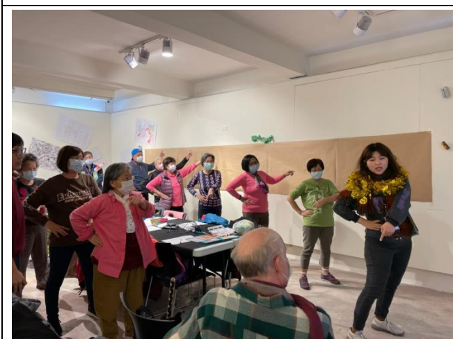
開場 Disco 舞