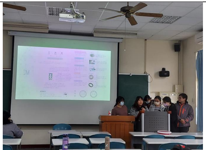
「玉、遇、育」-台灣玉石奇遇記的向心力，DM 一目瞭然，各個單元。