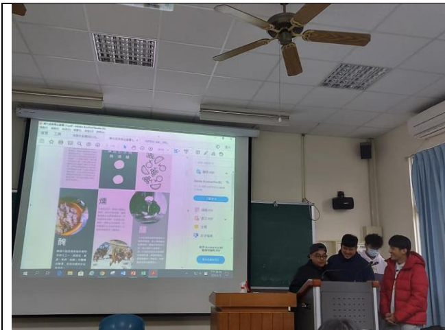
煙燻釀組別，介紹原住民三種傳統保存食物的方式。 此為 DM