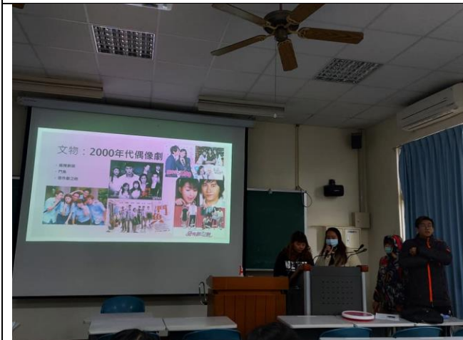
時光電視，介紹惡作劇之吻改編日本翻拍，及經典片段。