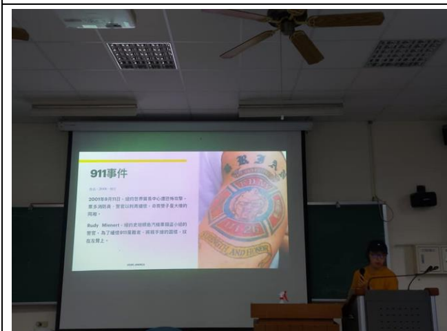
TATTOO, INK & STORY 介紹此圖為記錄 911 受難的記憶刺青。