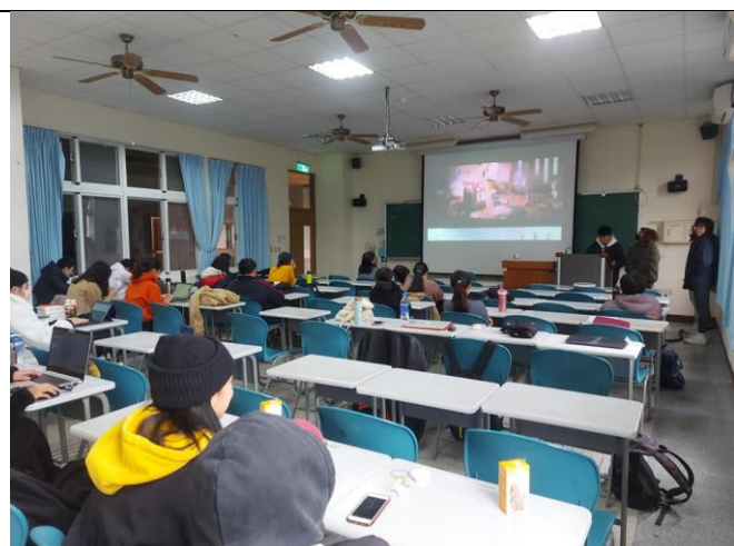
「日常 X 校園 X 東華」文字攝影展