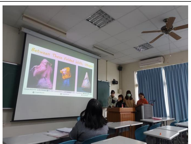
女力-喀擦喀擦看見她，介紹以色列女攝影師之作品。