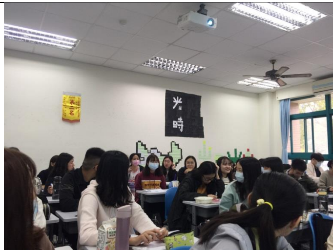
講師請學生回答問題