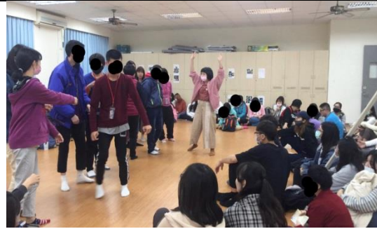
與學生一同玩團康遊戲