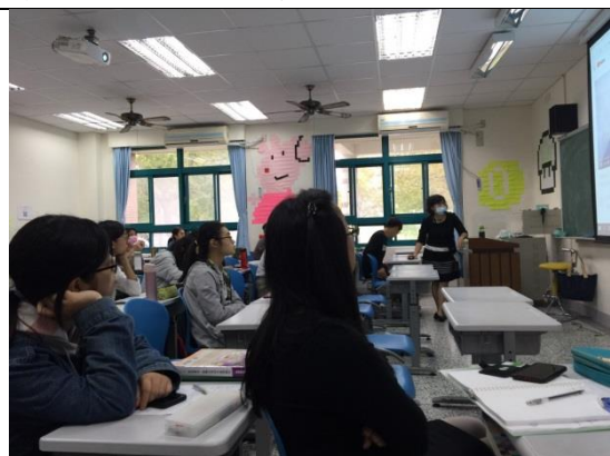
講師分享實際的例子給同學聽