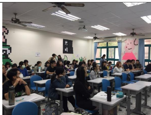
學生在思考講師的問題