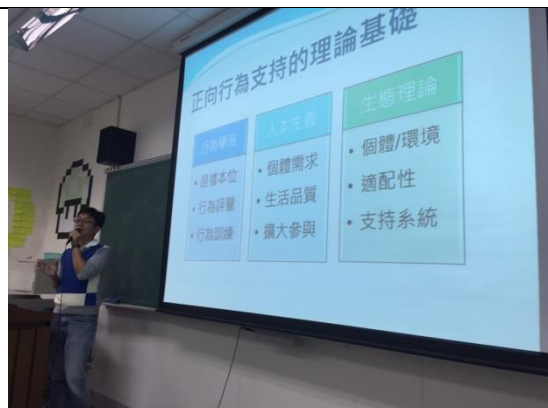
講師在介紹正向行為支持的理論