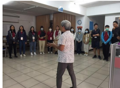
自閉症的大朋友們一一的用有趣的方式做自我介紹