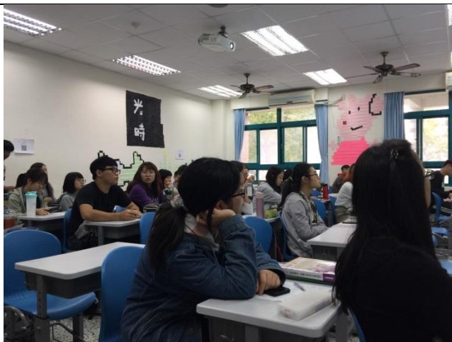
學生專心的聽講師演講