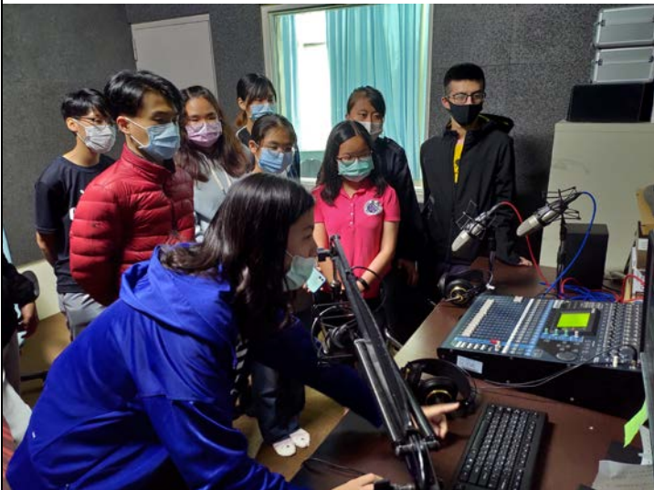
▲錄音間教學：控制台、錄製設備 / 數位編輯與後製 (因疫情影響，要求同學儘量配戴口罩，並以酒精消毒工作枱和麥克風，並打開錄音室門，以防止形成密閉空間)。