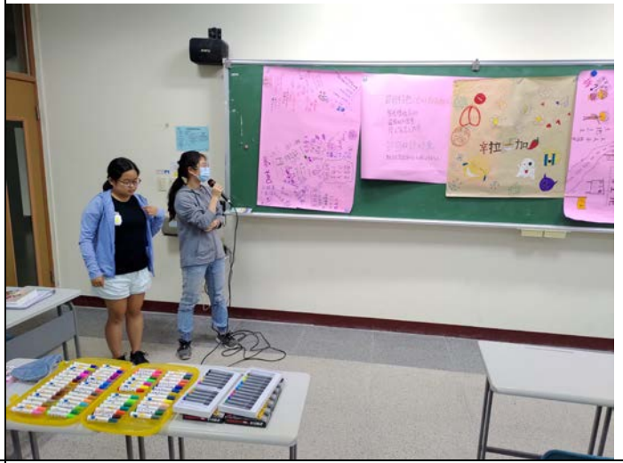
▲節目企劃報告與同學意見回饋。