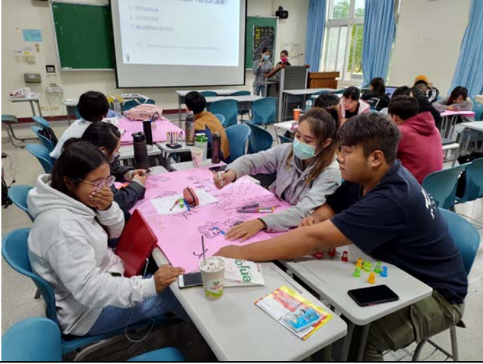
▲課堂小組破冰 / 腦力激盪與節目發想。