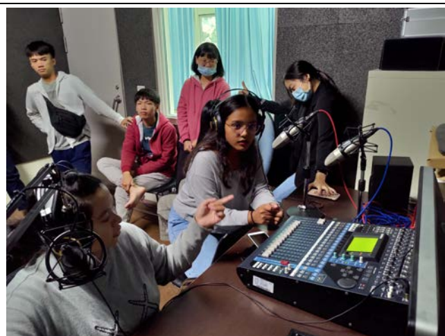
▲錄音間限時實戰：各組成員在錄音間限時實作並上傳雲端。