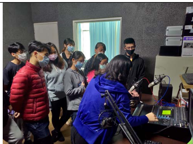
▲錄音間限時實戰：各組成員在錄音間限時實作並上傳雲端。