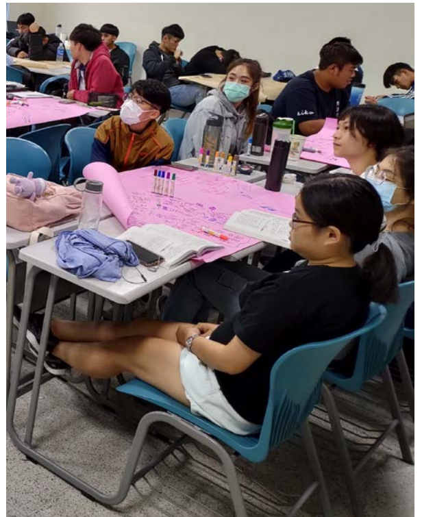
▲廣播節目聽審與意見回饋。