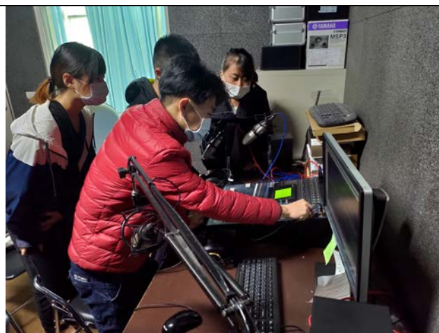
▲錄音間限時實戰：了解小組成員合作狀況，並讓同學體驗廣播人的分秒必爭的時效壓力。