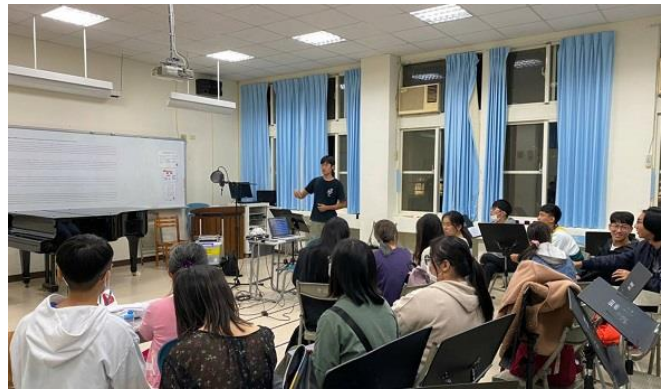
麥克風操作使用概念解說