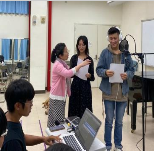
歌唱指導、人聲錄製