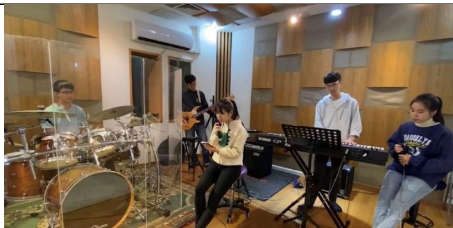
業界老師解說錄音工程概念