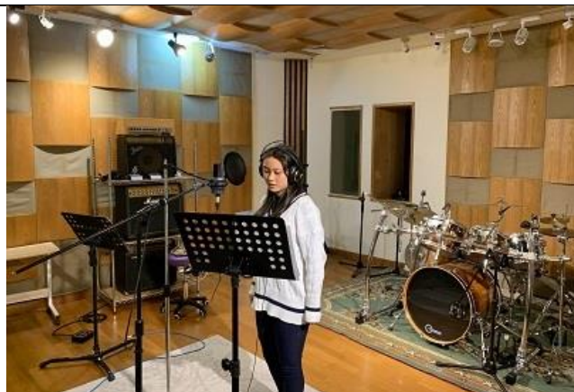
課任老師指導歌唱