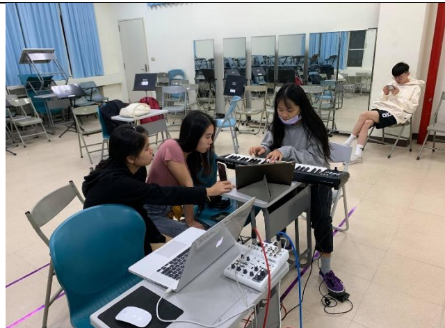
MIDI 音色挑選彈奏練習