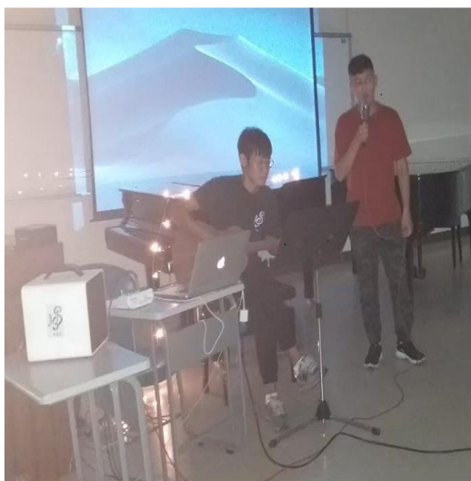
外籍生英語歌試唱