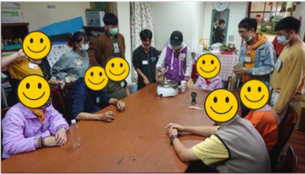
第四組小組活動-上午場-果凍 DIY