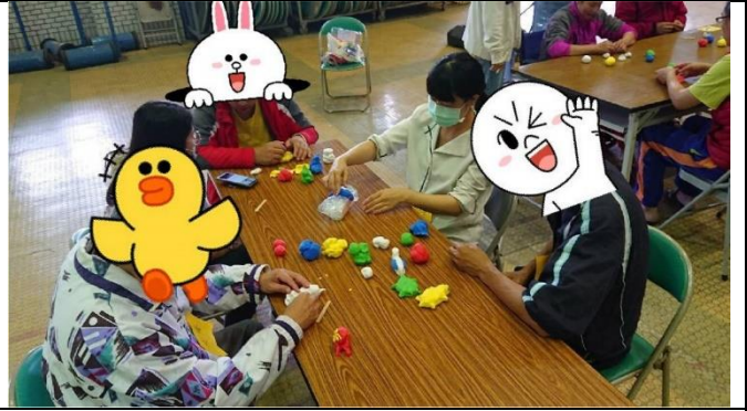
第三組小組活動-下午場-捏黏土