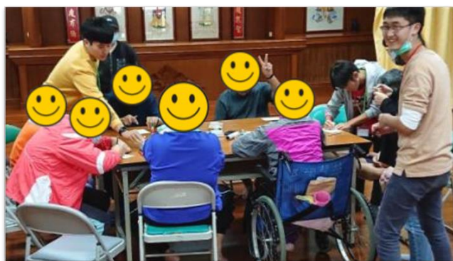
第三組小組活動-下午場-拼貼畫