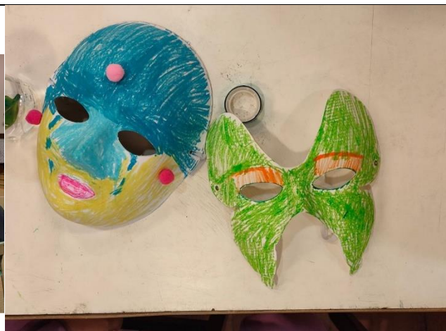
第三組小組活動-下午場-面具繪畫-住民作品