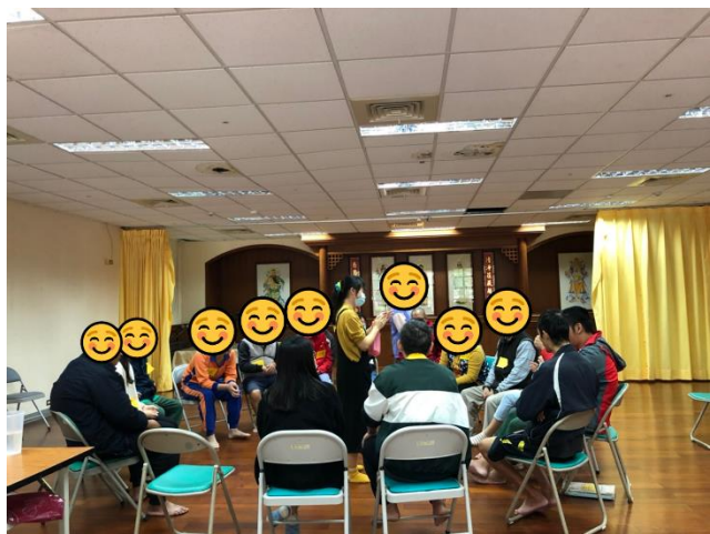
第三組小組活動-上午場-團康遊戲