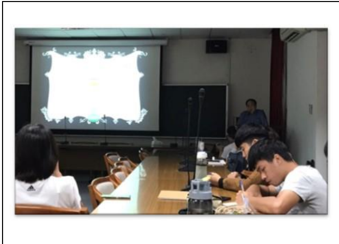
世光老師向同學們介紹思覺失調症