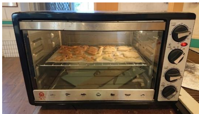
第一組小組活動-下午場-烤餅乾