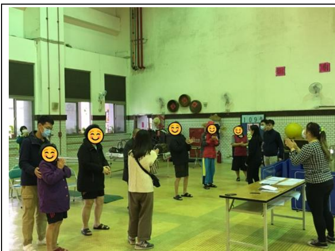
第一組小組活動-上午場-大地遊戲