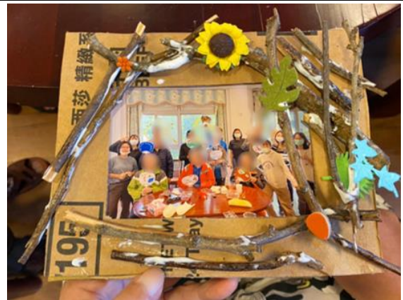
場域學習-小組活動-自製相框-住民作品