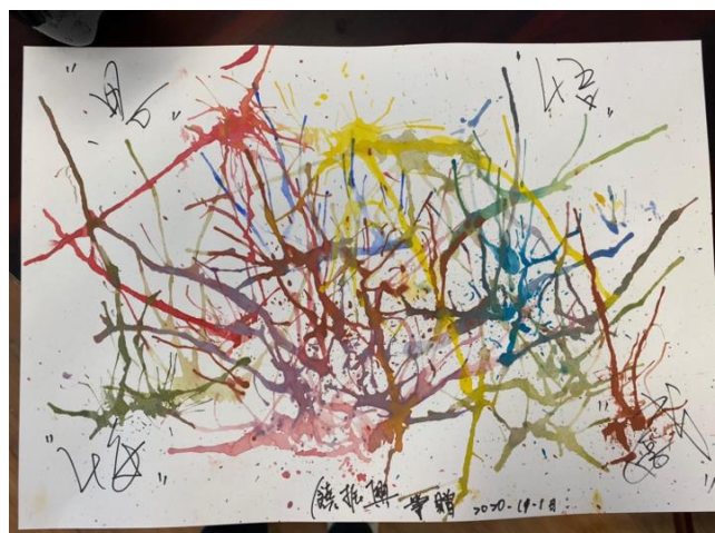
第二組小組活動-上午場-吹畫-住民作品