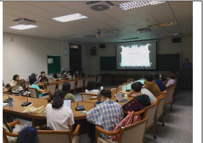
世光老師向同學們經驗分享