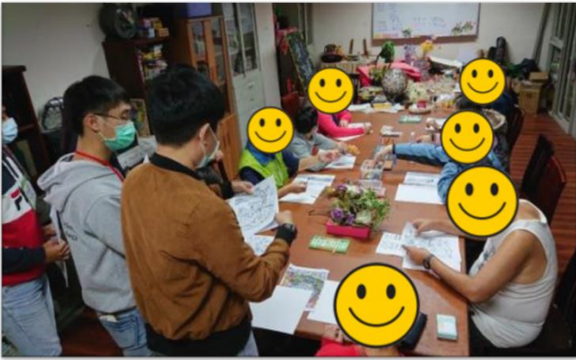
第四組小組活動-上午場-纏繞畫