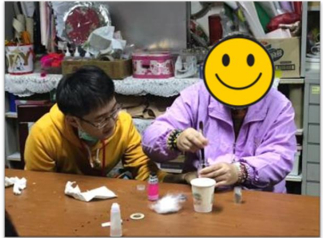
第四組小組活動-下午場-靜心瓶