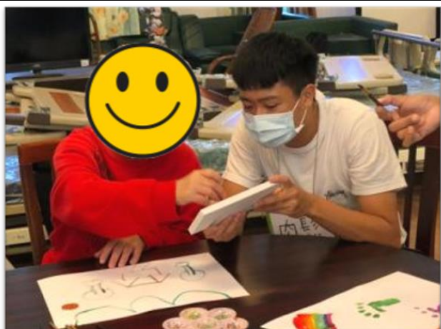
第三組小組活動-上午場-接力闖關