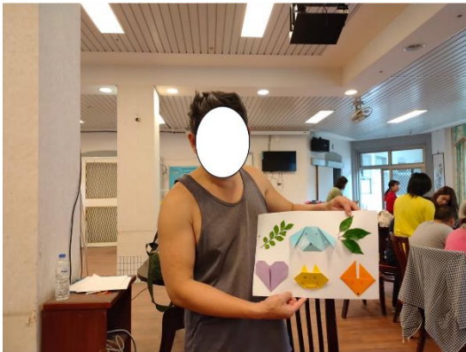
場域學習-小組活動-拼貼畫