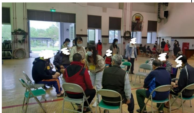
第三組小組活動-上午場-團康遊戲