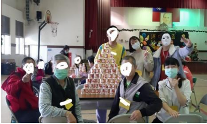
場域學習-小組活動-疊杯子