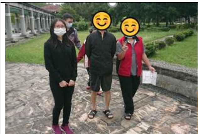
第一組小組活動-上午場-定向越野