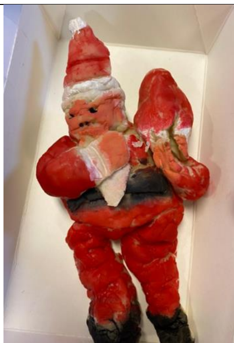
第二組小組活動-下午場-黏土自畫像