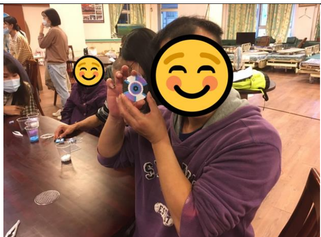
第二組小組活動-上午場-手作活動-拼豆