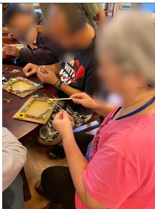
第二組小組活動-下午場-相框製作