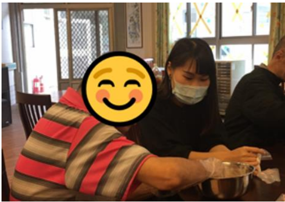
場域學習-小組活動-手做餅乾