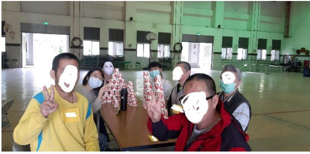
第三組小組活動-上午場-疊杯子