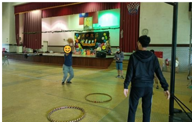
第一組小組活動-下午場-球類好好玩