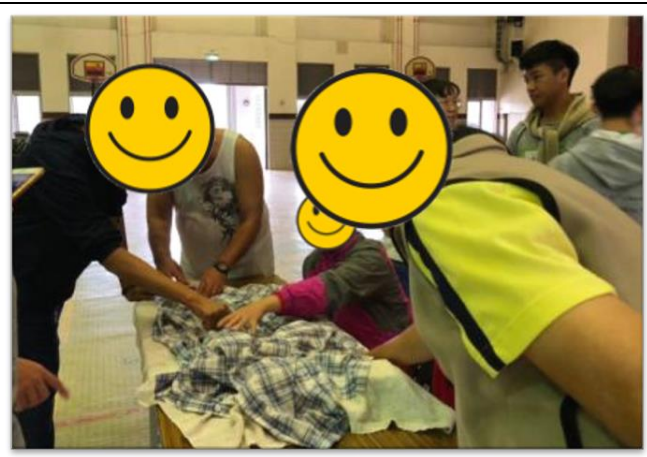
第四組小組活動-下午場-萬聖 RPG