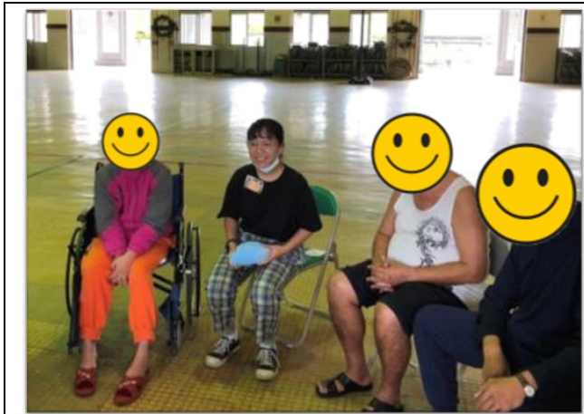
第四組小組活動-上午場-歌曲傳唱