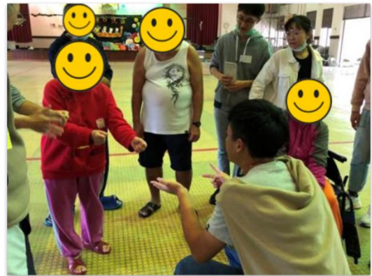
場域學習-小組活動-萬聖 RPG