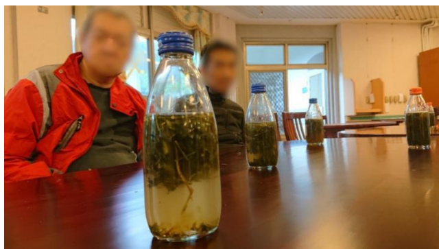
第二組小組活動-上午場-防蚊液 DIY