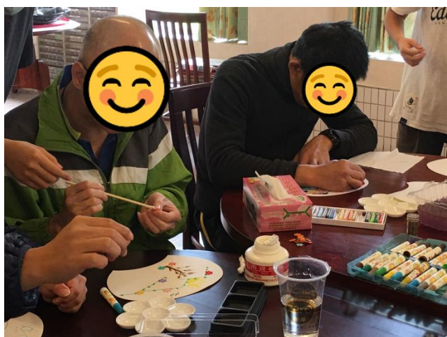
第二組小組活動-上午場-彩繪紙扇