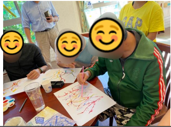
場域學習-小組活動-吹畫