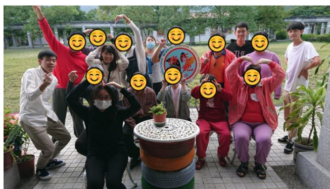
第一組小組活動-下午場-小組合照