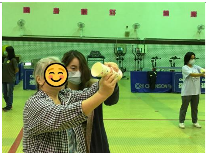
第二組小組活動-下午場-紙杯滑翔翼