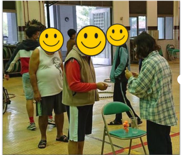
第四組小組活動-下午場-趣味遊戲