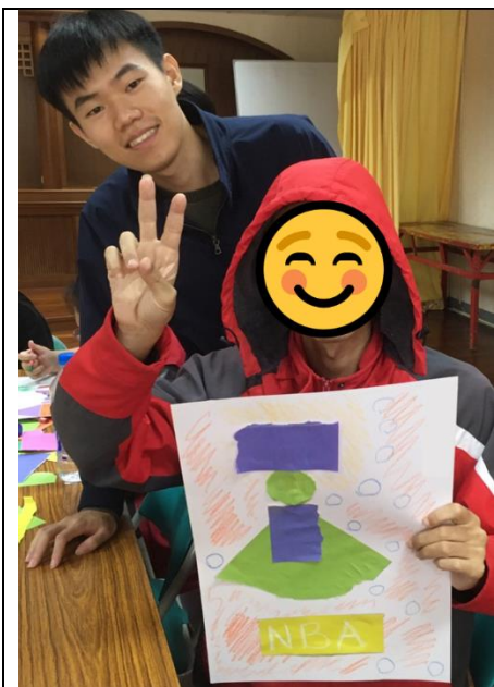
第一組小組活動-上午場-手撕拼貼畫