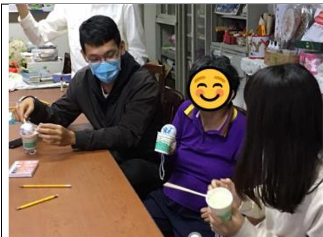
第一組小組活動-上午場-製作劍玉