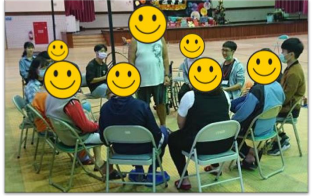
場域學習-小組活動-歌唱遊戲