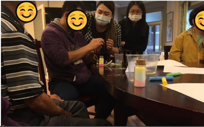
場域學習-小組活動-彩色鹽瓶