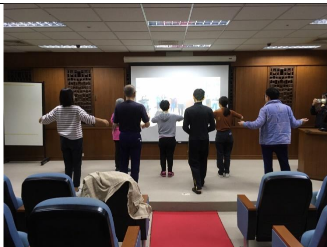
第二組小組活動-下午場-唱歌跳舞