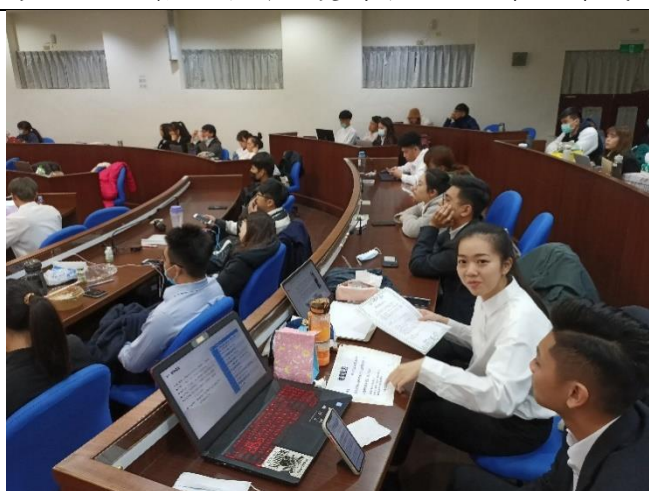
期末企劃提案台下準備與聆聽