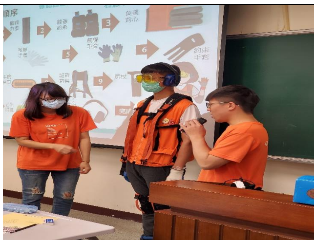
彭祖體驗講座：了解銀髮需求現況&裝置穿戴說明