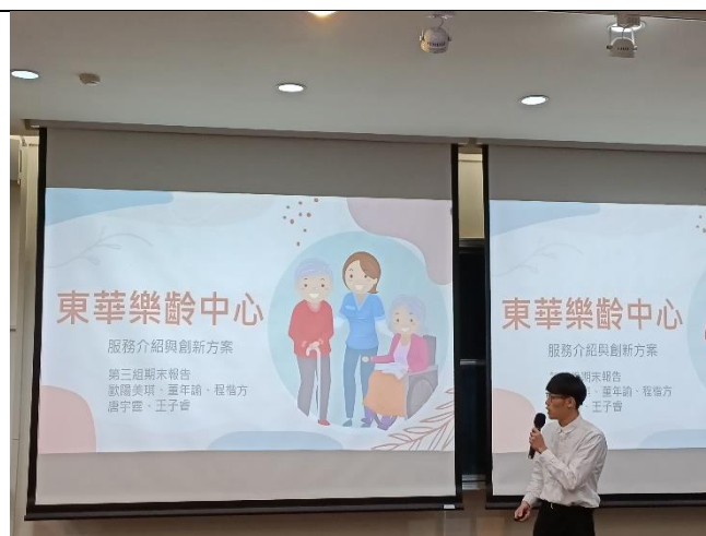
學生企劃簡報提案中