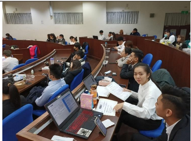
學生台下聆聽和準備