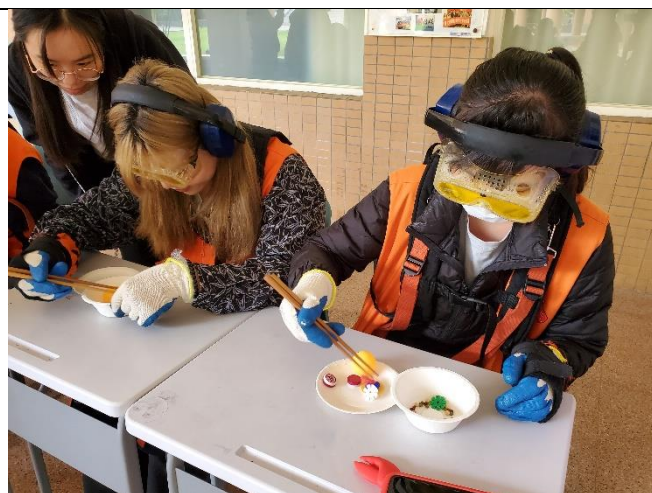
銀髮族長者身體機能在用餐上的模擬體驗