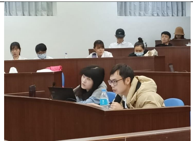
校外專家評審回饋