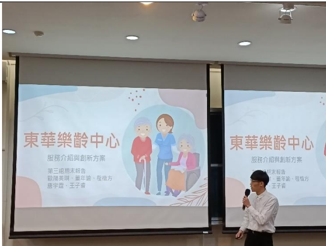
學生企劃簡報提案中