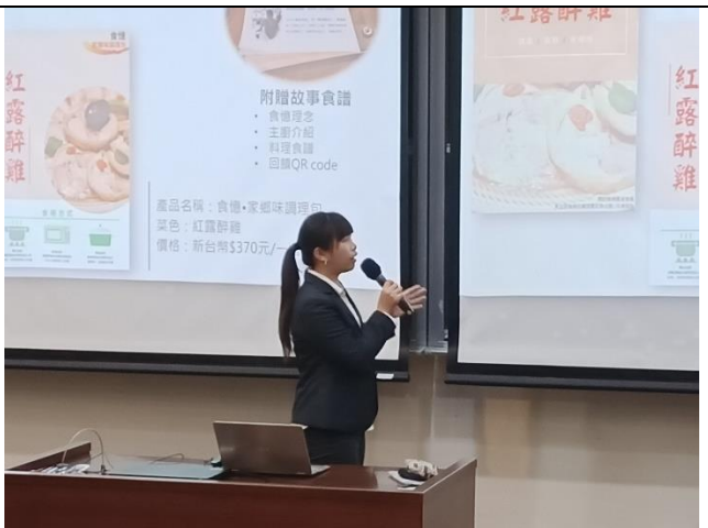
學生專業簡報表達