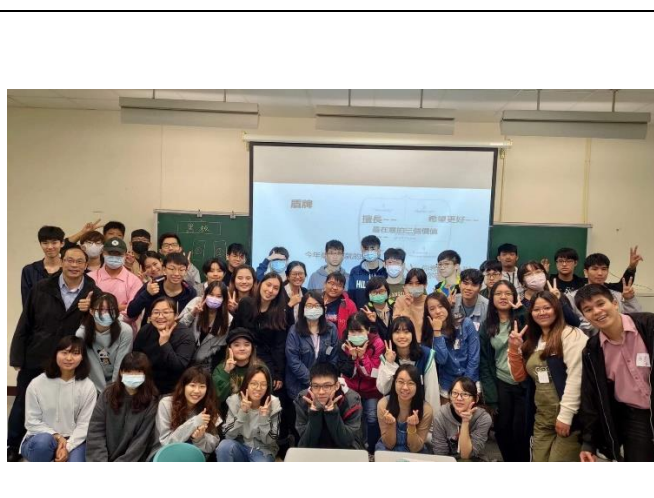
戀愛工作坊活動大合照