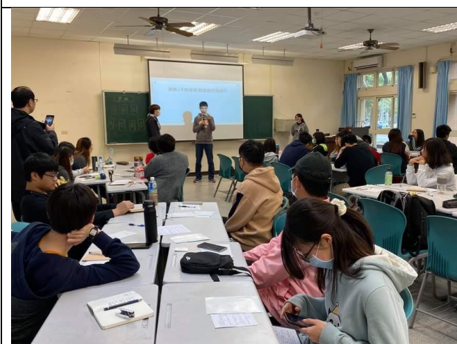
課程讓學生認識自己的特質