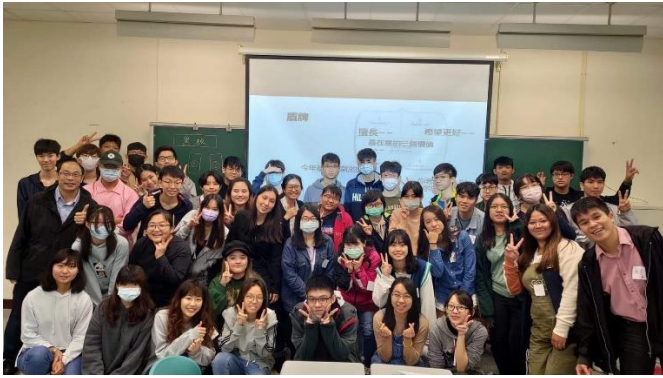
戀愛工作坊活動大合照