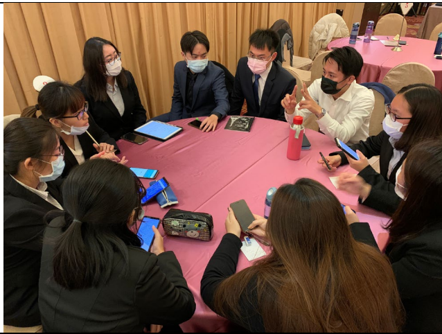
成果發表後之檢討