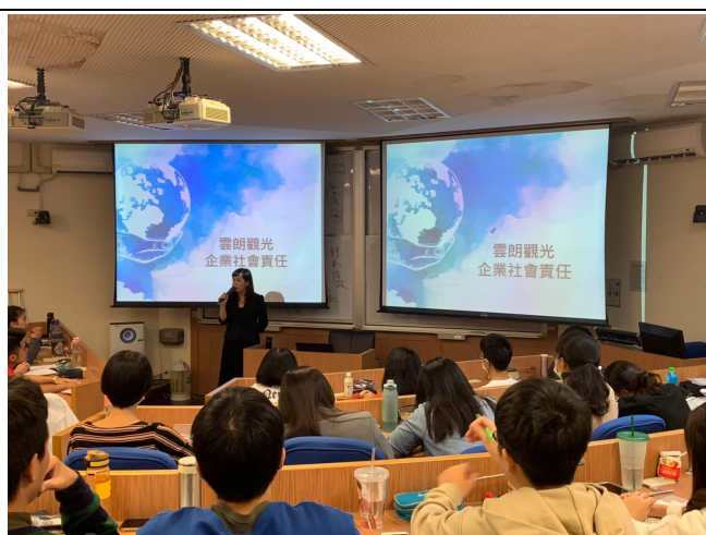
活動策略實務分享