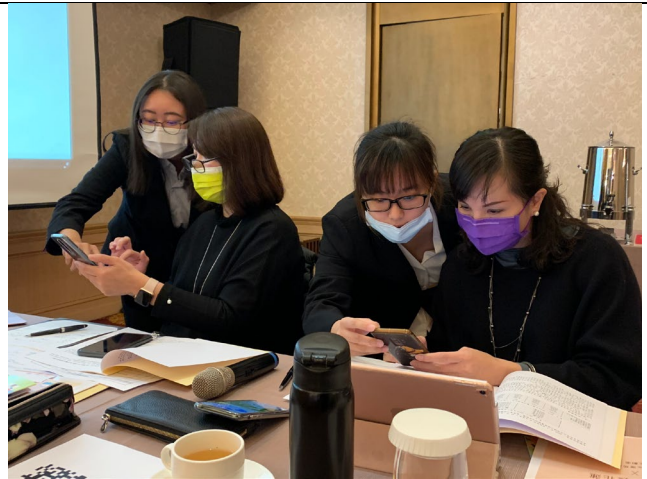
報告組同學引導兩位總經理進行 APP 操作