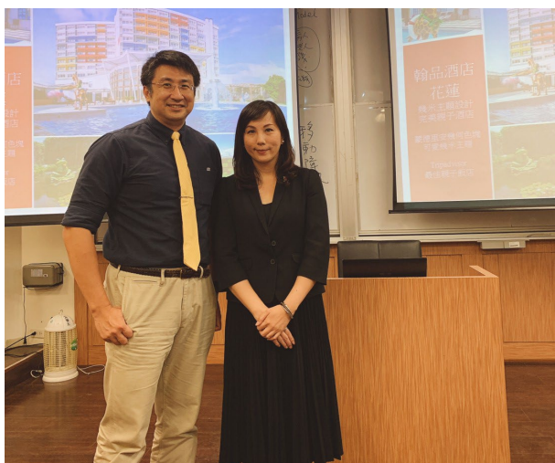
花蓮翰品總經理活動策略實務分享