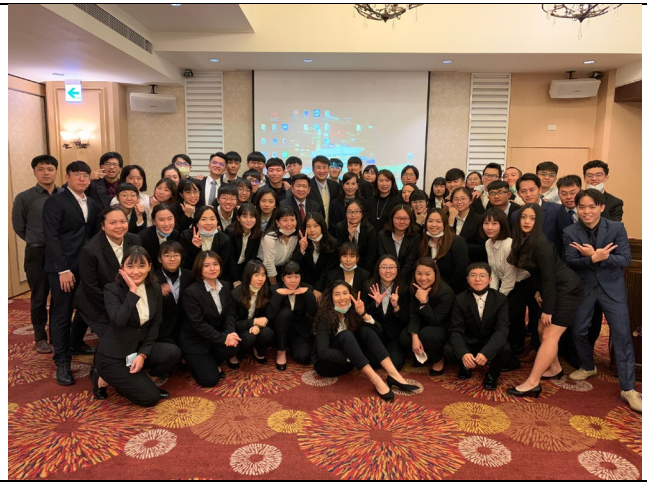
期末成果發表大合照