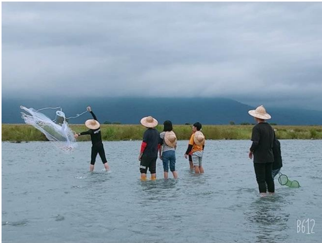
03-文化體驗：阿美族捕魚