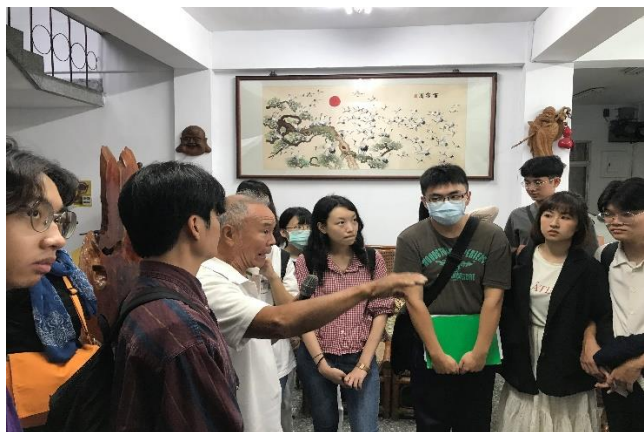
01-1022 花蓮文史走讀踏查