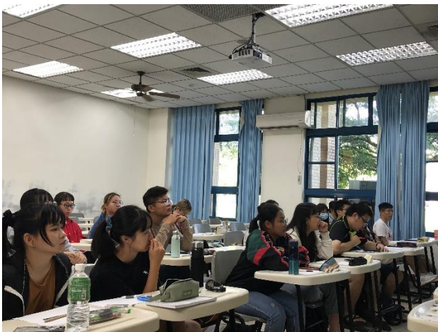
03-親密關係與社會工作關連介紹