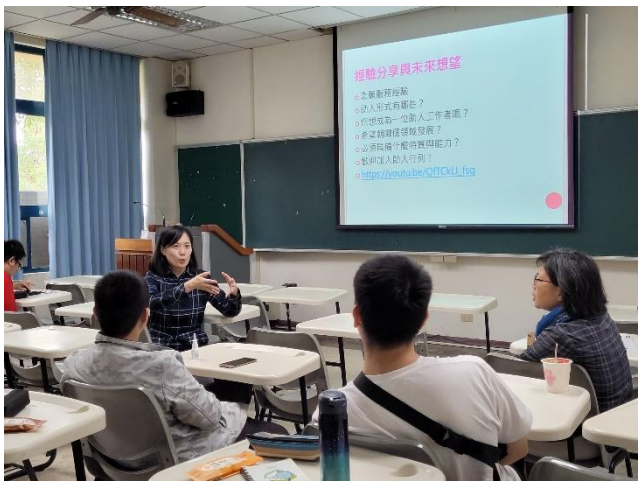
03-助人經驗分享與發現