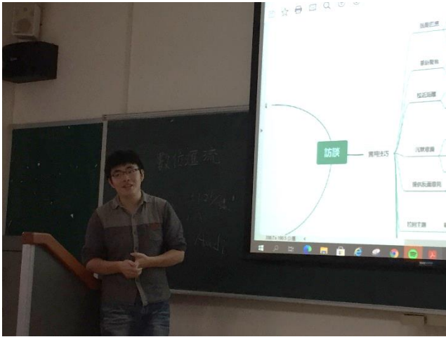
01-訪談準備工作簡介