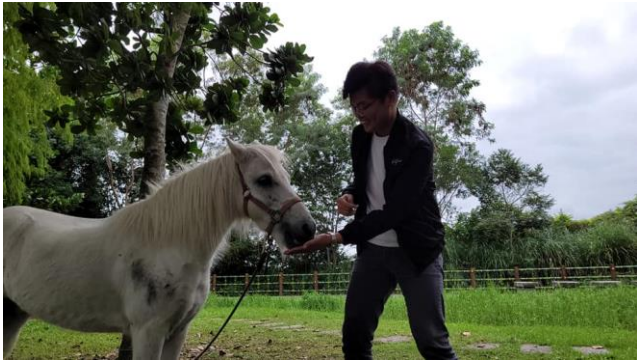
01-體驗與馬兒近距離接觸