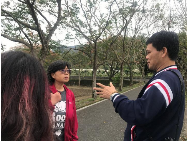
01-整體分布、分工介紹