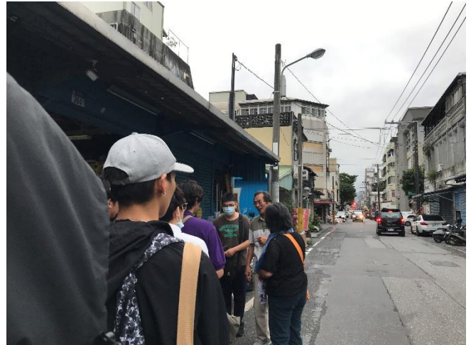
04-當地里長簡介溝仔尾舊時風貌