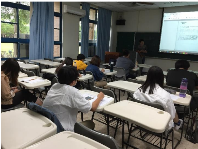
03-文史報告撰寫基礎知識與概念