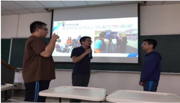
01-新聞影像拍攝技巧示範