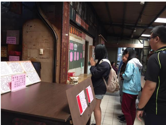
03-社區走讀：信仰中心