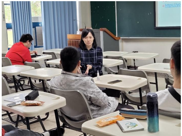
02-與同學互動討論助人方法