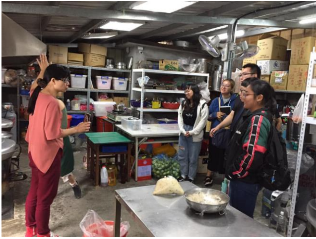
01-社區協會概況了解