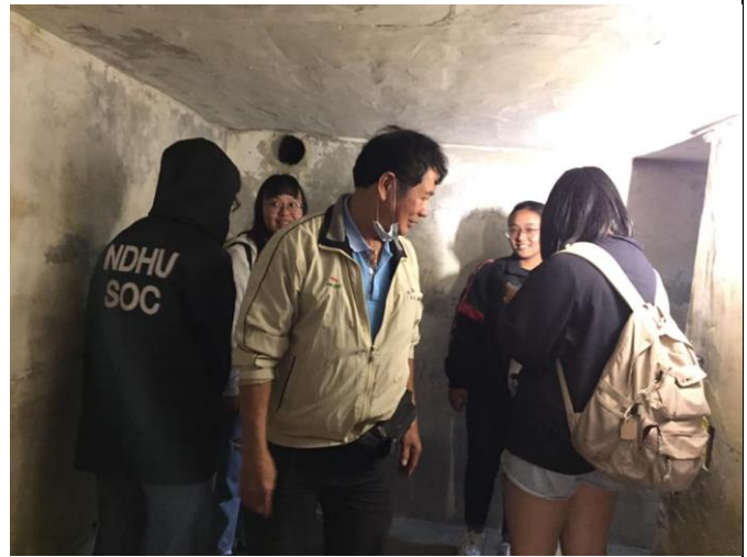
02-社區走讀：舊時防空洞