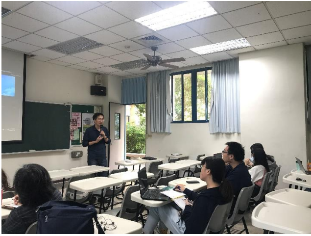
01-回應同學目前製作進度疑問