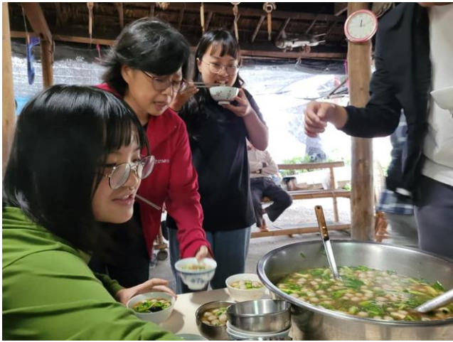
03-與社區長者共作共食