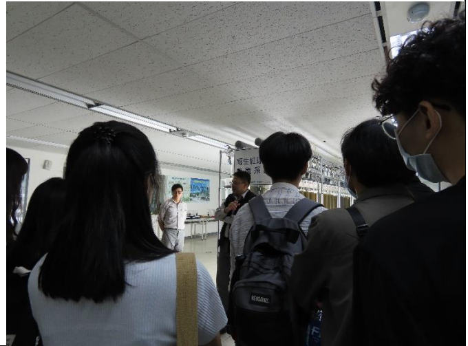
02-食用生物技術介紹