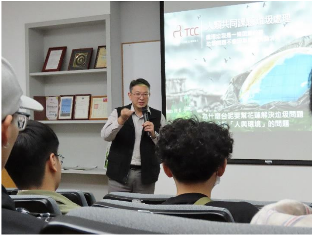
01-台泥和平廠歷程與實踐永續簡介