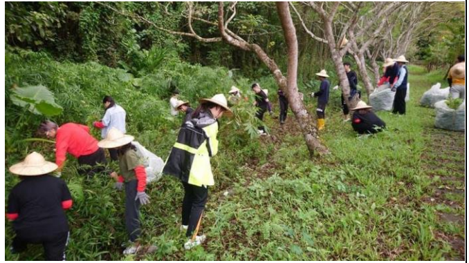
02-體驗活動：拔除小花蔓澤蘭