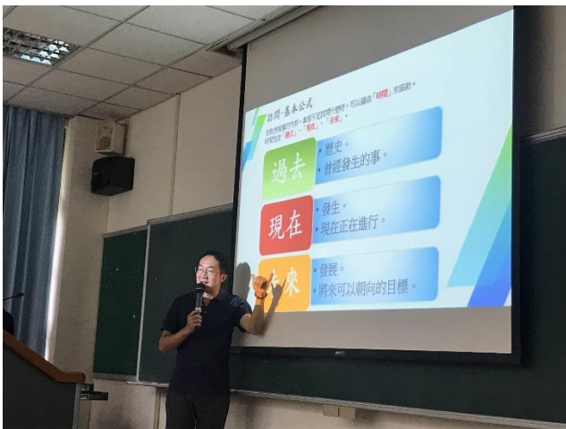
03-新聞訪問呈現核心問題