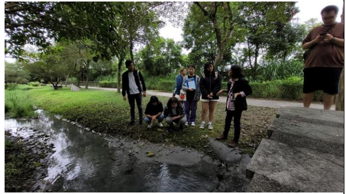
02-初英山整體環境探索