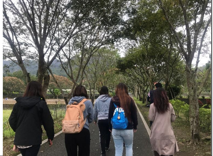
02-實際走訪工作區域