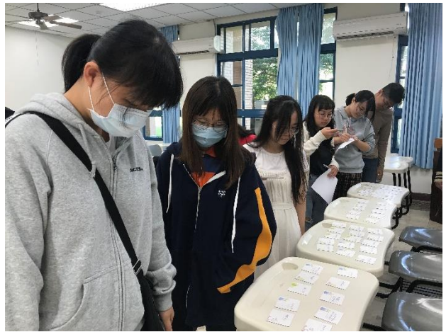
02-同學挑選情感卡牌