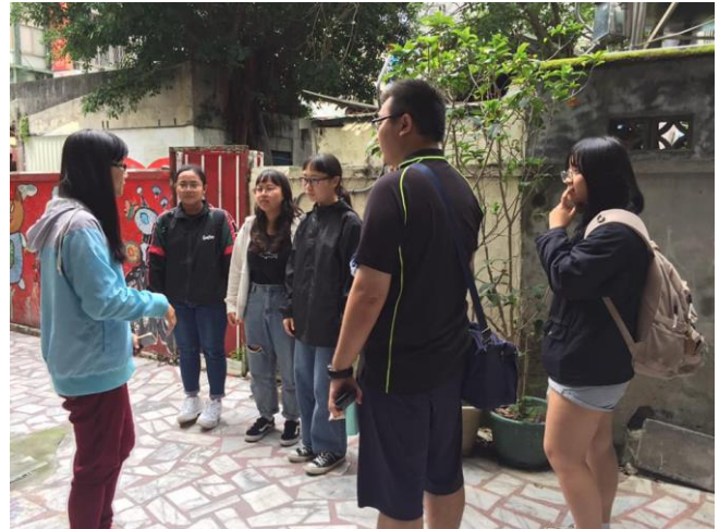
04-社區走讀：建築保存