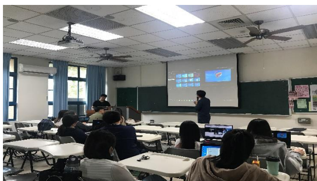
03-1126 新聞編輯技巧教學