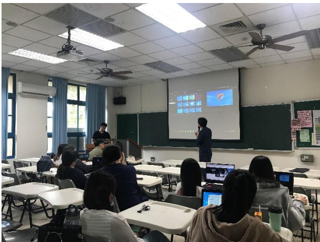
03-實際操作技巧教學