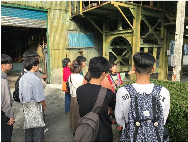
01-糖廠舊時背景介紹