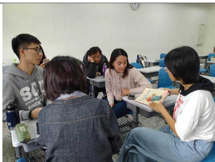
學生在性別教育論文報告中，設計分組進行十分鐘繪本教學演示與分享