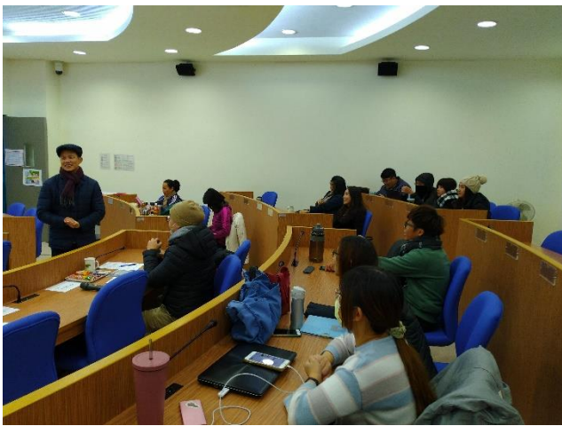
德勝老師開場介紹參與者，說明流程及評分事項