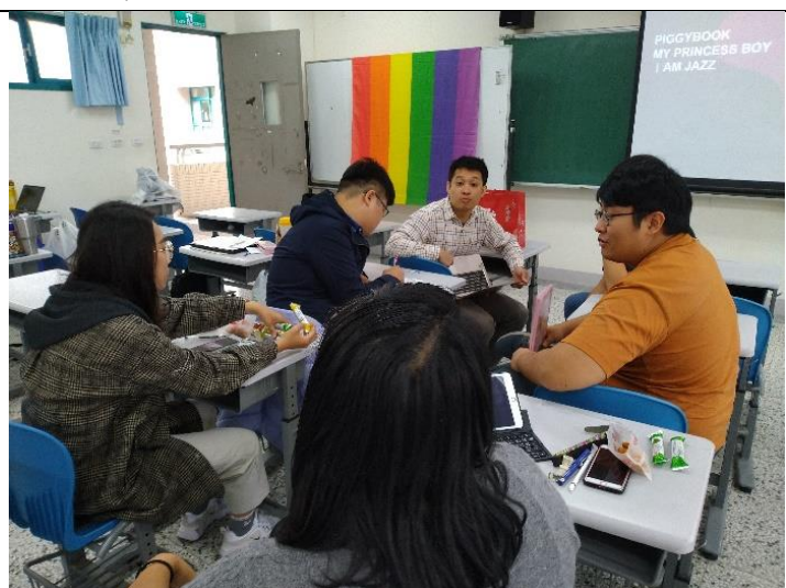
小組在參與工作坊活動後，針對老師給予建議進行影片劇本的撰寫與修正