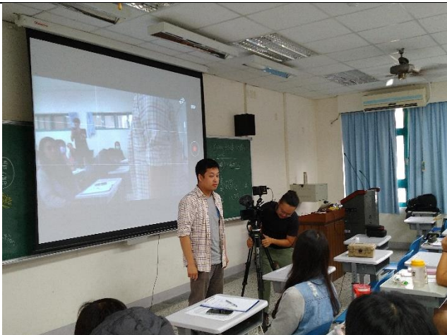
志宏老師邀請一位同學到台前來做主角，並操作鏡頭做運鏡解說