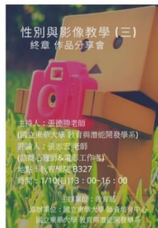
網站活動公告-性別與影像工作坊