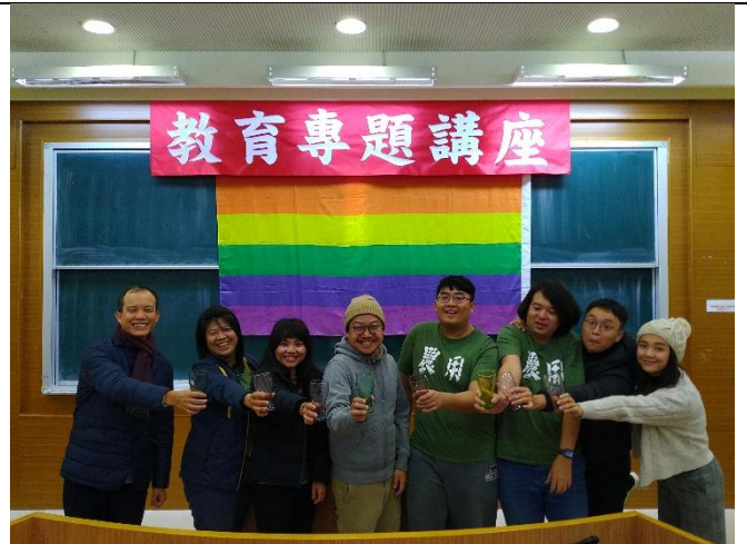
兩位老師與組別「何解」頒獎合影