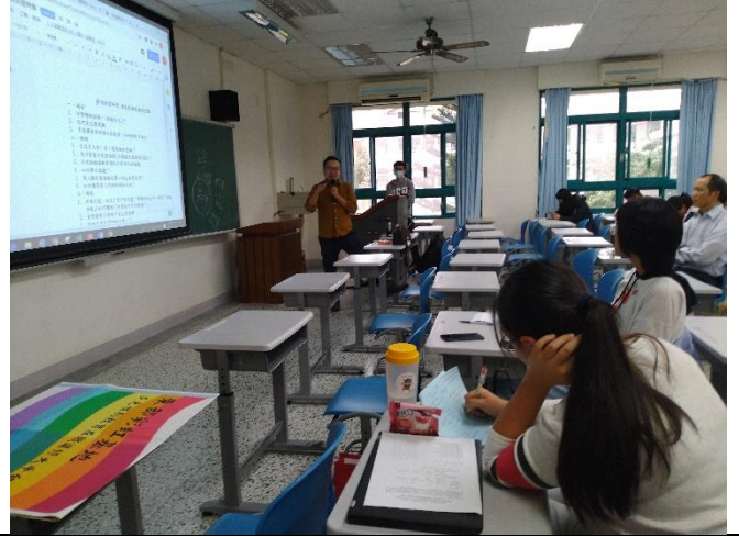
志宏老師針對劇本對白指點出建議事項