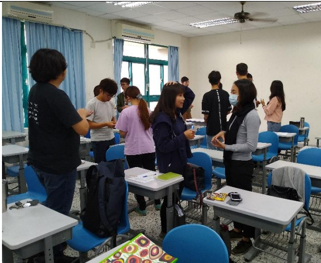
第一個活動-破冰遊戲，搭配多寶桌遊，讓大家都動起來