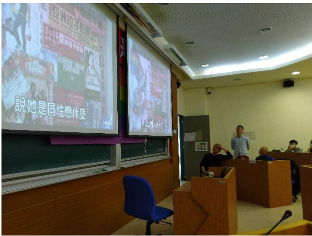
同透過影片分享自己身為女同志的故事