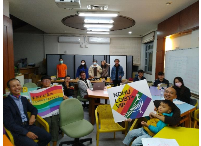
全體人員合影留念