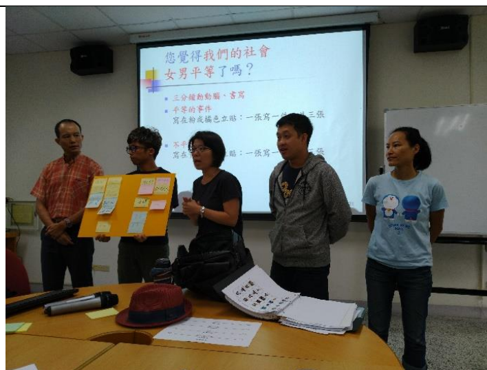
使用先使用便利貼討論法，各組學生再分組上台報告組內共識