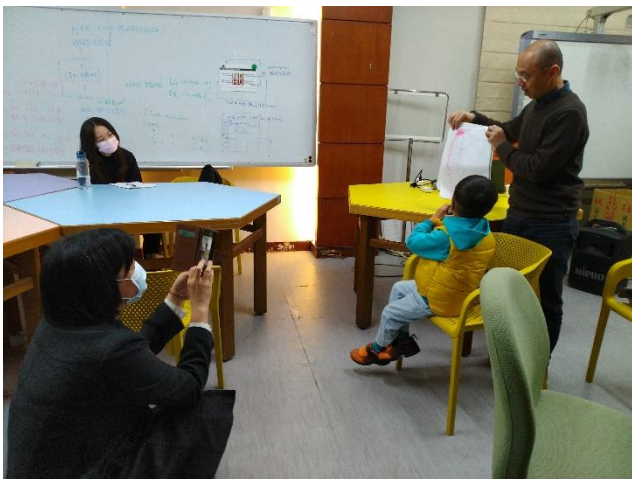
偕同照顧的姐姐一同到場參與活動、給予支持