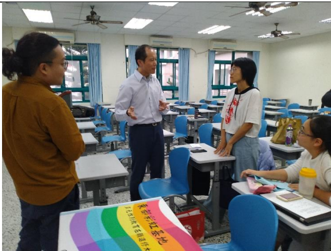
活動後仍把握機會，學員向老師請教如何將敘說故事轉換成場景形成影片