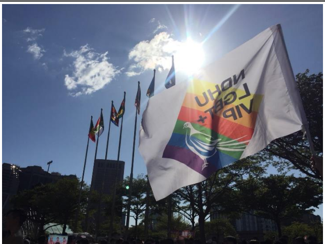
飛舞的國旗與 VIP 團隊旗幟