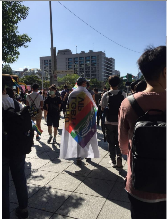
德勝老師(背影)與同學一同遊行