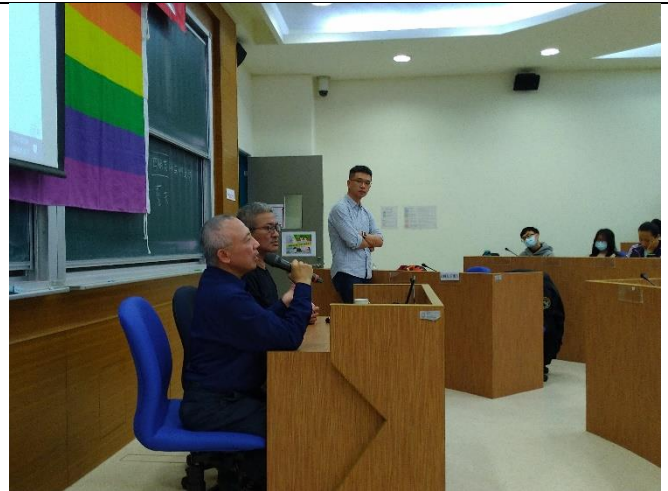
同說明為什麼要出書的緣由及時空背景