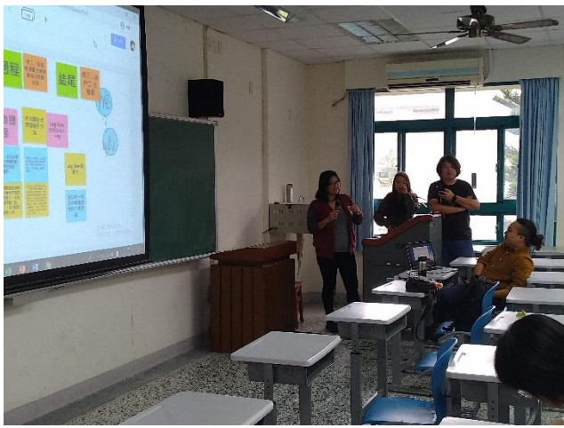
學員們分享初版的作品、草案，志宏老師給予意見回饋