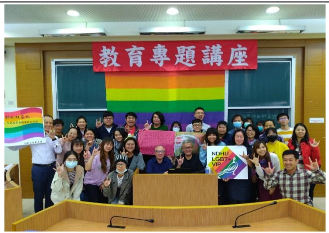
全體人員與台灣同志熱線夥伴合影