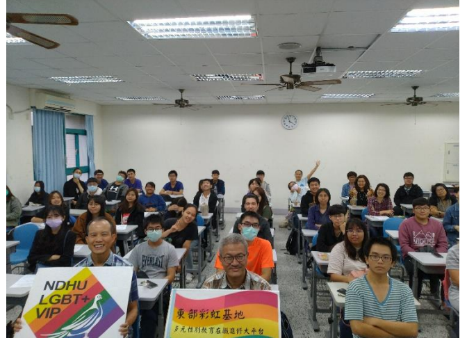
全體學員和喀飛老師合影