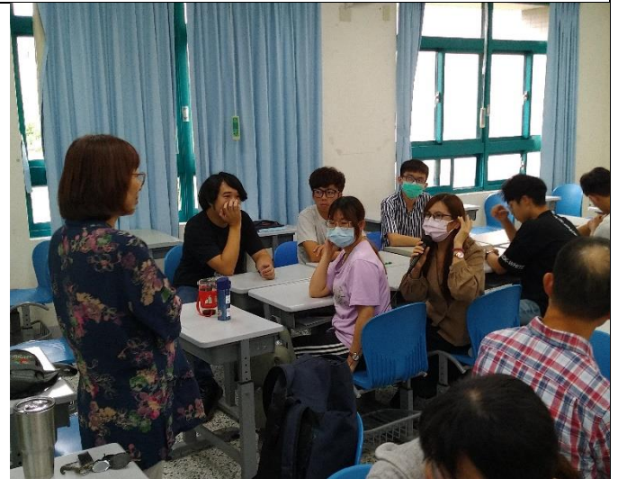
學員向菊吟老師提問並方想自己在教育現場所遇到的問題