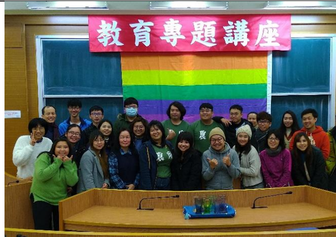
全體人員於成果發表完畢後一同合影