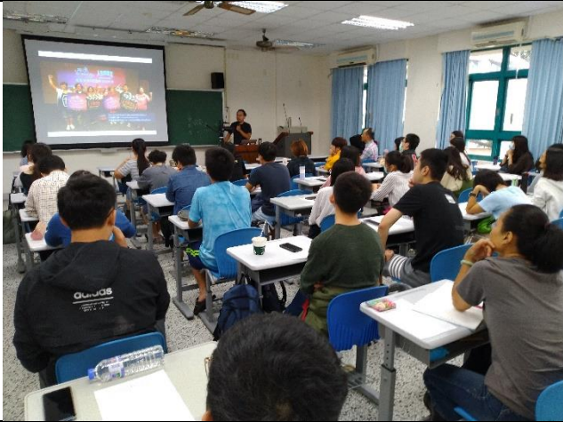
志宏老師先分享幾段影像呈現果不錯的作品