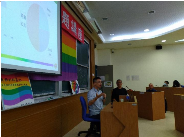
智偉主任跟大家分析台灣性別議題相關態度調查，推論未來的性別在照顧議題上的挑戰