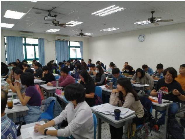
人數眾多，學員們認真聆聽講座