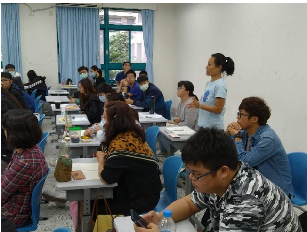
學員根據講者的背景、演講內容積極提問