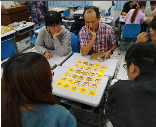
德勝老師也加入小組體驗桌遊-誰是豬隊友