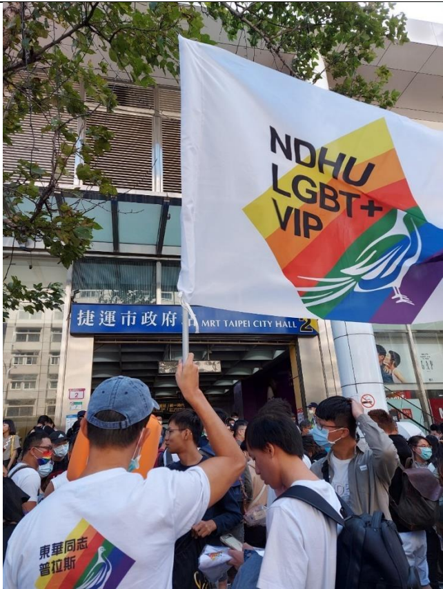
與 VIP 團隊成員一同於捷運站口集合