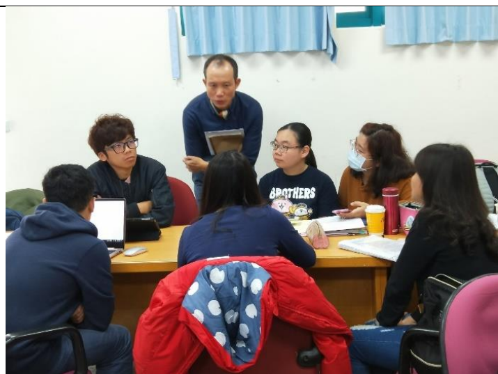
分組討論中，德勝老師一同參與學員的學習，適時提出見解