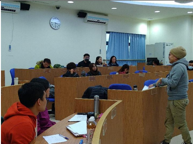
志宏老師針對各組給予點評