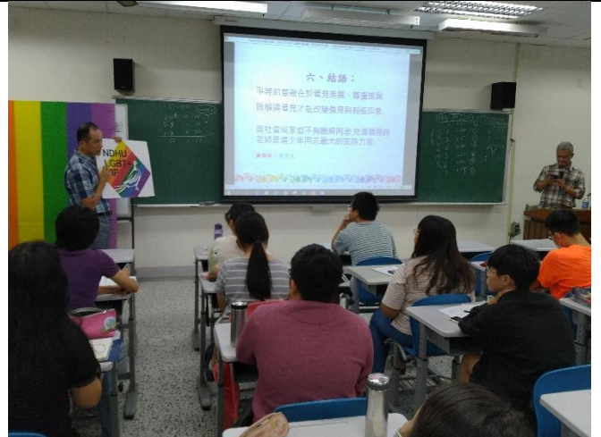
德勝老師適時給予回饋及觀點分析