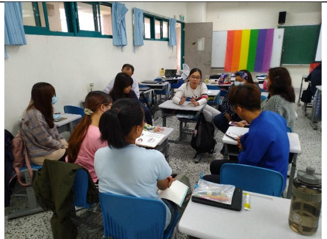
小組彼此分享交流、給予回饋，並邀請互相拍攝擔任主角