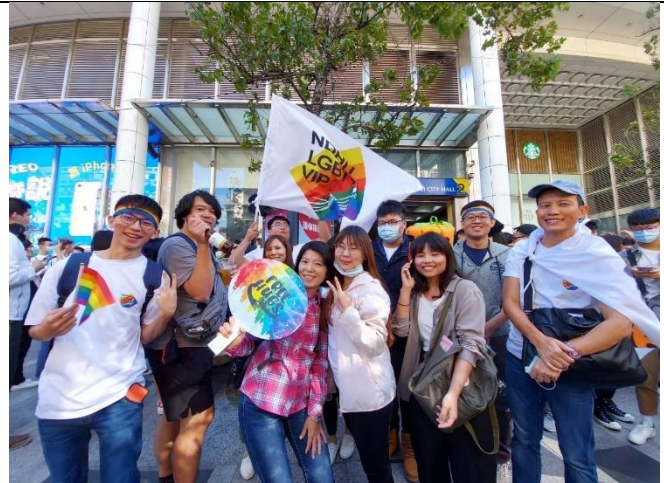
學員與德勝老師一同合影留念