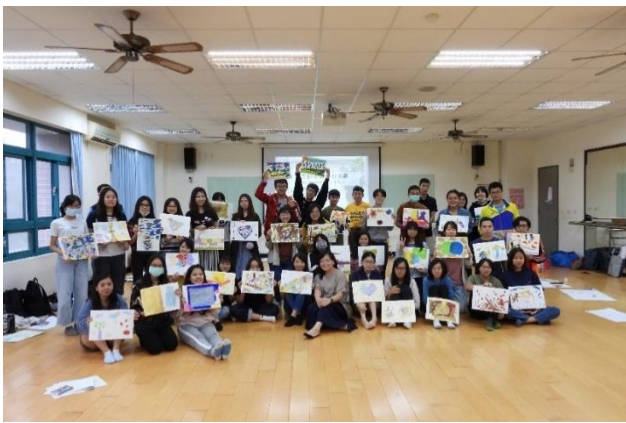
11/21 藝術治療體驗工作坊成果