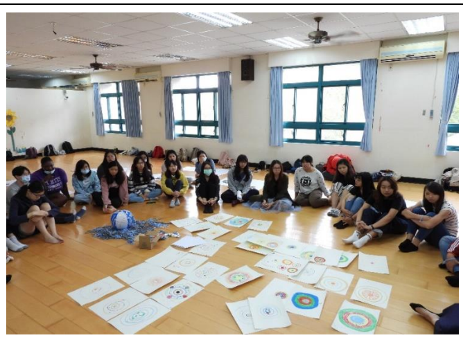
最後的凝聚與分享