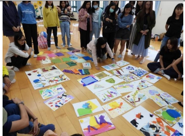
大家在自由繪畫後的分享