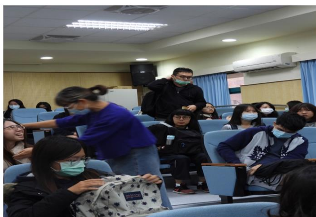
麗端媽媽在會後與分享同學感人的擁抱