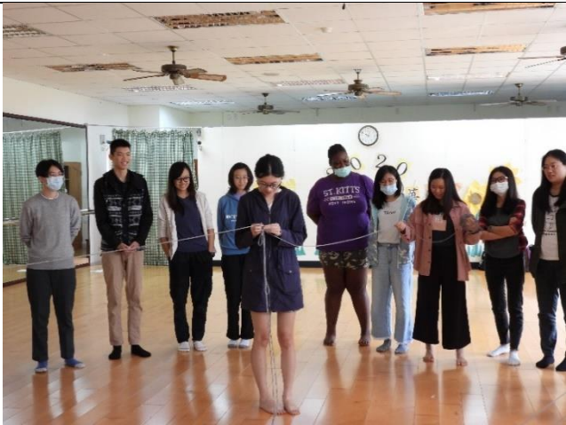
活動前的暖身，牽出每個人的心絲