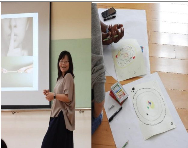
講座與學生的創作