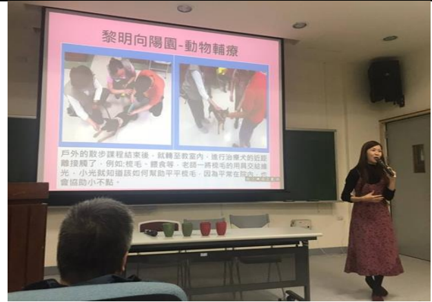
12/7 家庭照護之認識自閉症