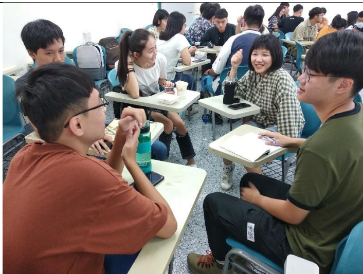
田野工作坊分桌交流