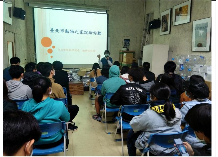
臺北動物之家參訪