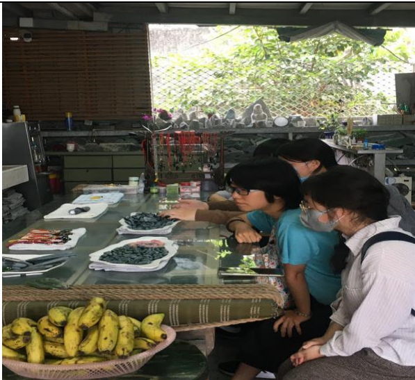
體驗台灣玉之磨玉活動之一(如豐琢玉工坊)