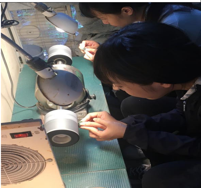
體驗台灣玉之磨玉活動之三(如豐琢玉工坊)