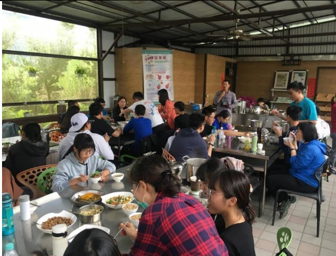
體驗午餐 DIY 之一(江玉寶有機農場)