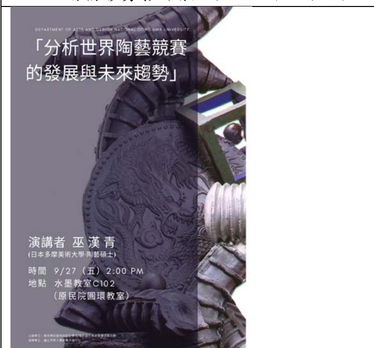
第一場 演講者巫漢青老師 演講海報