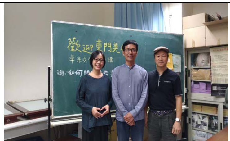
演講者 卓來成館長與群組老師合照