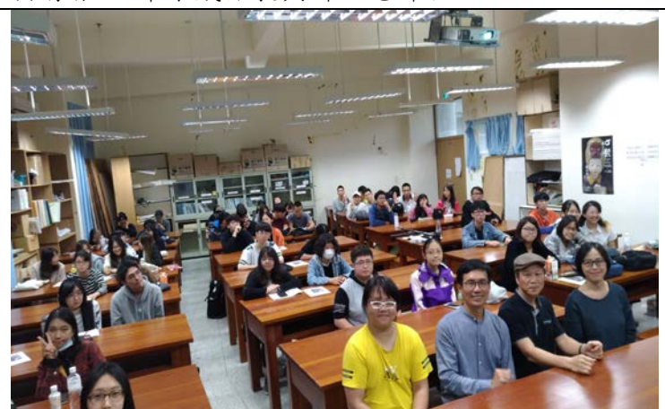
第二場聆聽者全體合影