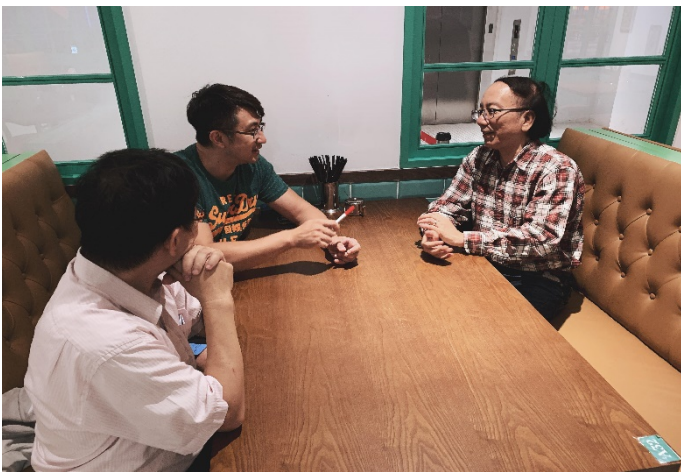
三位教授討論授課內容