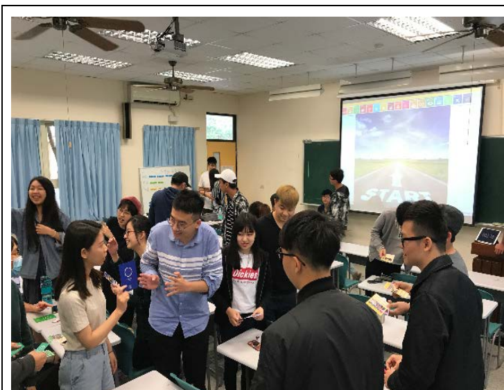
同學進行 SDG3000 遊戲時討論決策內容