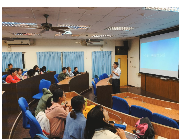
傑華老師上課情形