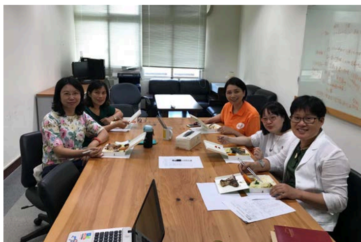
4月月會第一次全體老師到齊一起開會討論